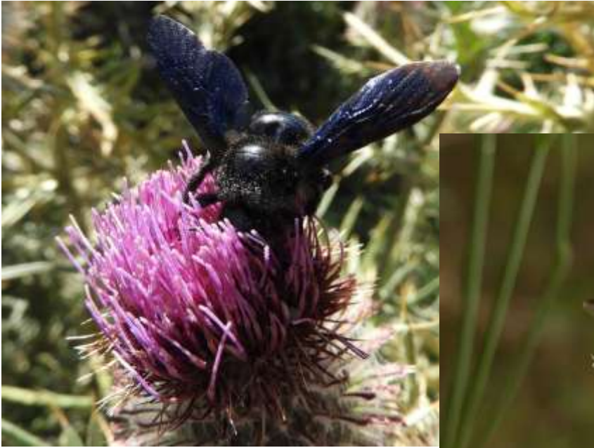
Blauwzwarte houtbij