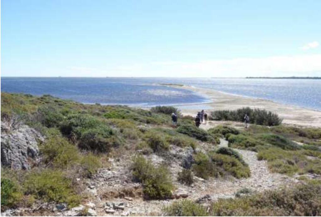
Uitzicht vanaf zuidwestelijke punt van l'Île St-Martin