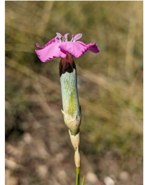
Dianthus sylvestris / Bosanjer