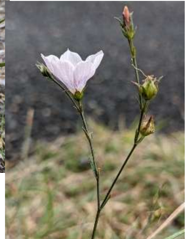
Linum tenuifolium / Smal vlas