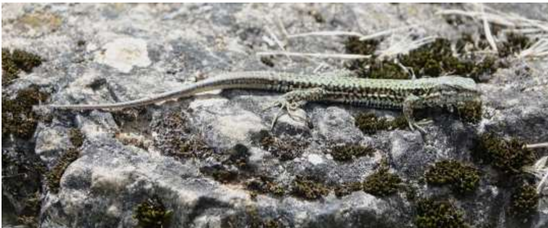
Muurhagedis