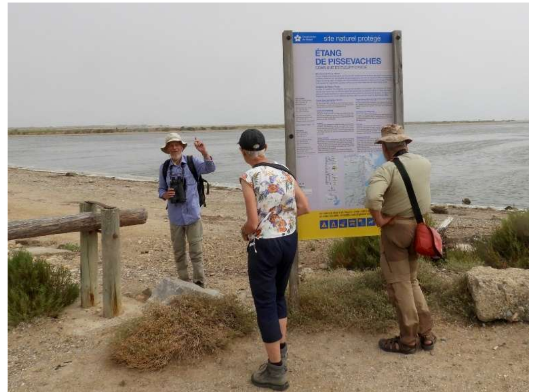
Étang de Pissevaches