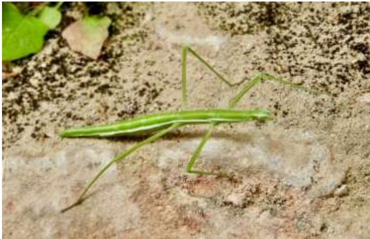
Wandelende tak