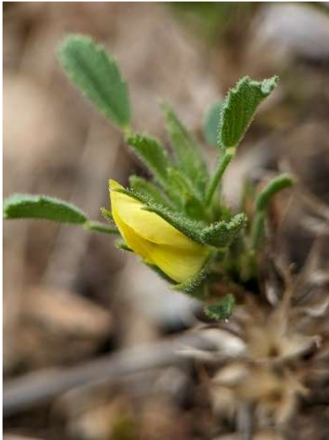
Ononis pulsilla