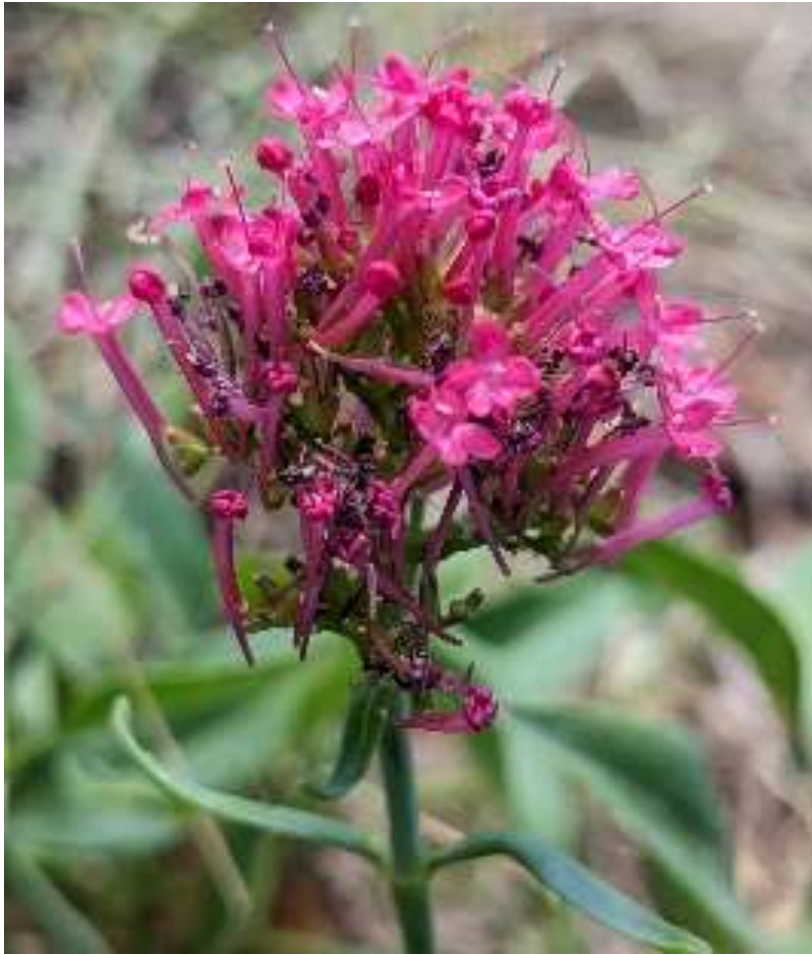
Centranthus ruber / Rode spoorbloem