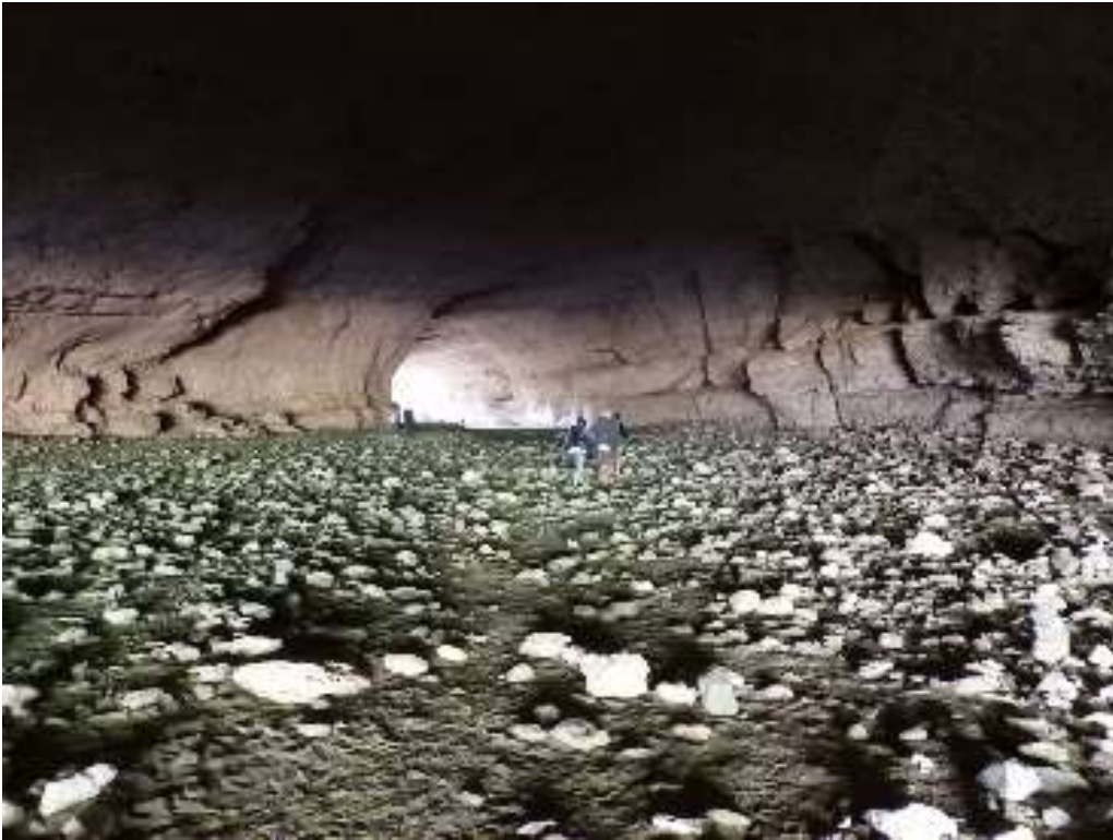
200m natuurlijke onderdoorgang van rivier de Cesse

Wij zijn via een pad langs de kloof naar de onderaardse tunnel van de droge rivierbedding van de Cesse gelopen. De brede tunnel is heel hoog en in de verte zie je het licht van de uitgang.