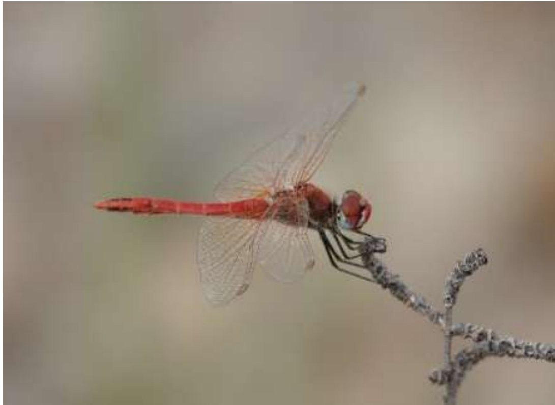
Sympetrum fonscolombii / Zwervende heidelibel