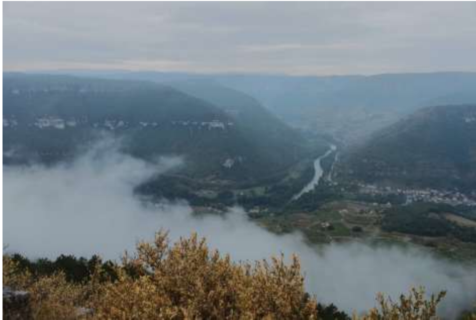
Uitzichten bij de wandeling en het gedenkteken boven de ruïne de la Chateau de Peyrelade, Op de voorgrond Buxusstruiken die ten prooi aan de Buxusmot zijn gevallen.