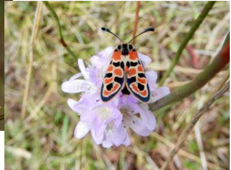
Bloeddropje / Zygaena fausta