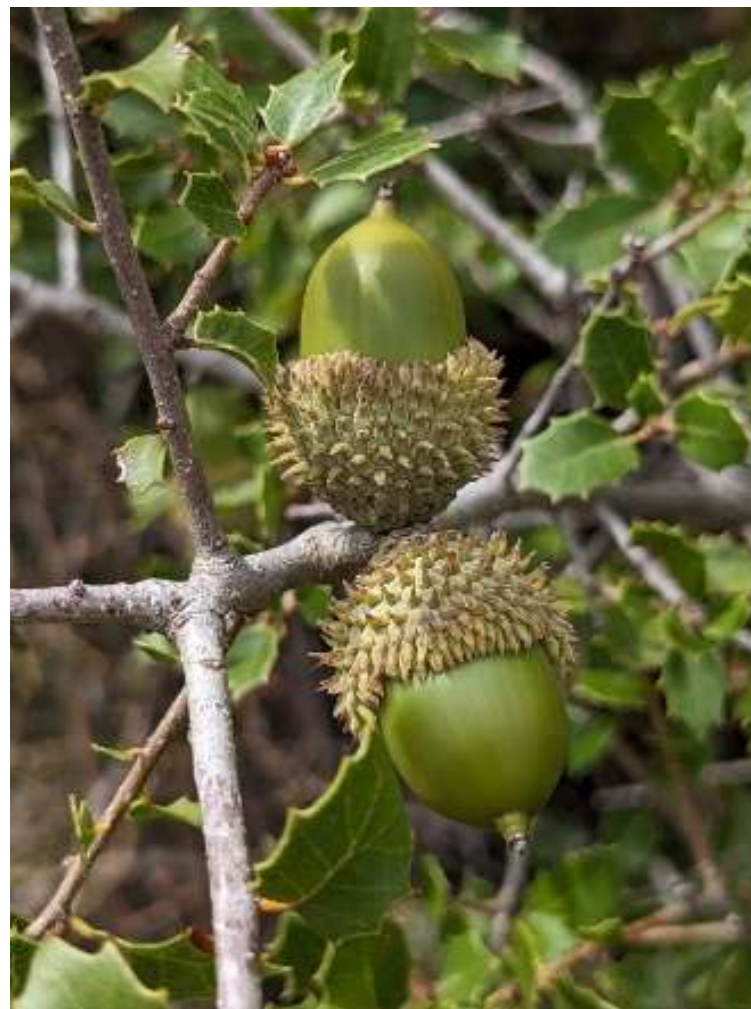
Quercus ilex / Steeneik