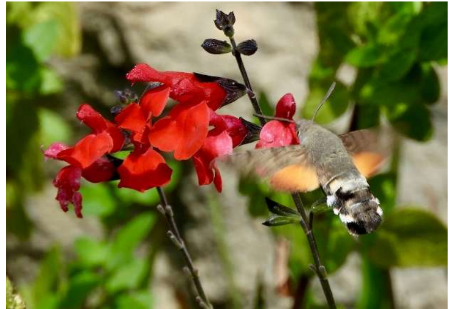
..... met een Kolibri vlinder

Het dorpje is heel sfeervol en je kunt de rivier oversteken langs een replica van een trébuchet, een soort katapult.