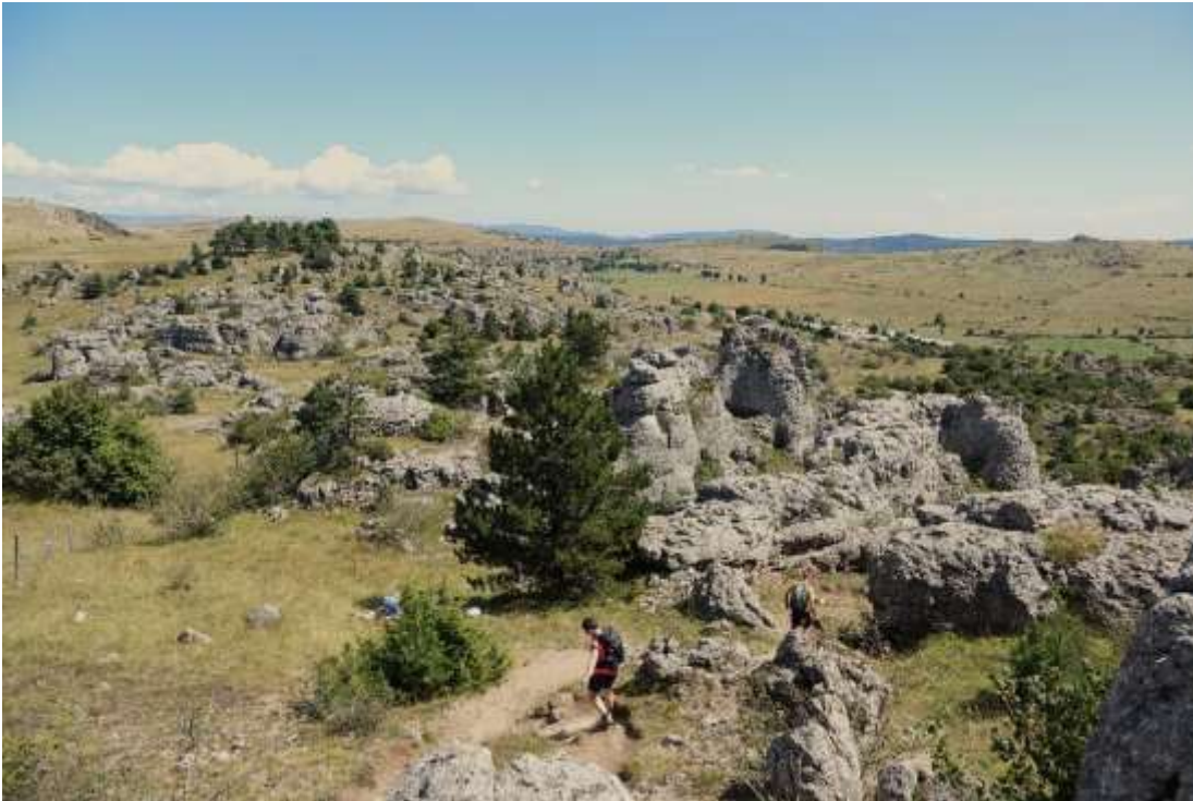
De “chaos” zoals de Fransen dat noemen, bij Nîmes le Vieux