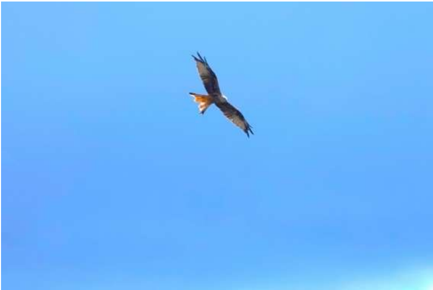
wouw