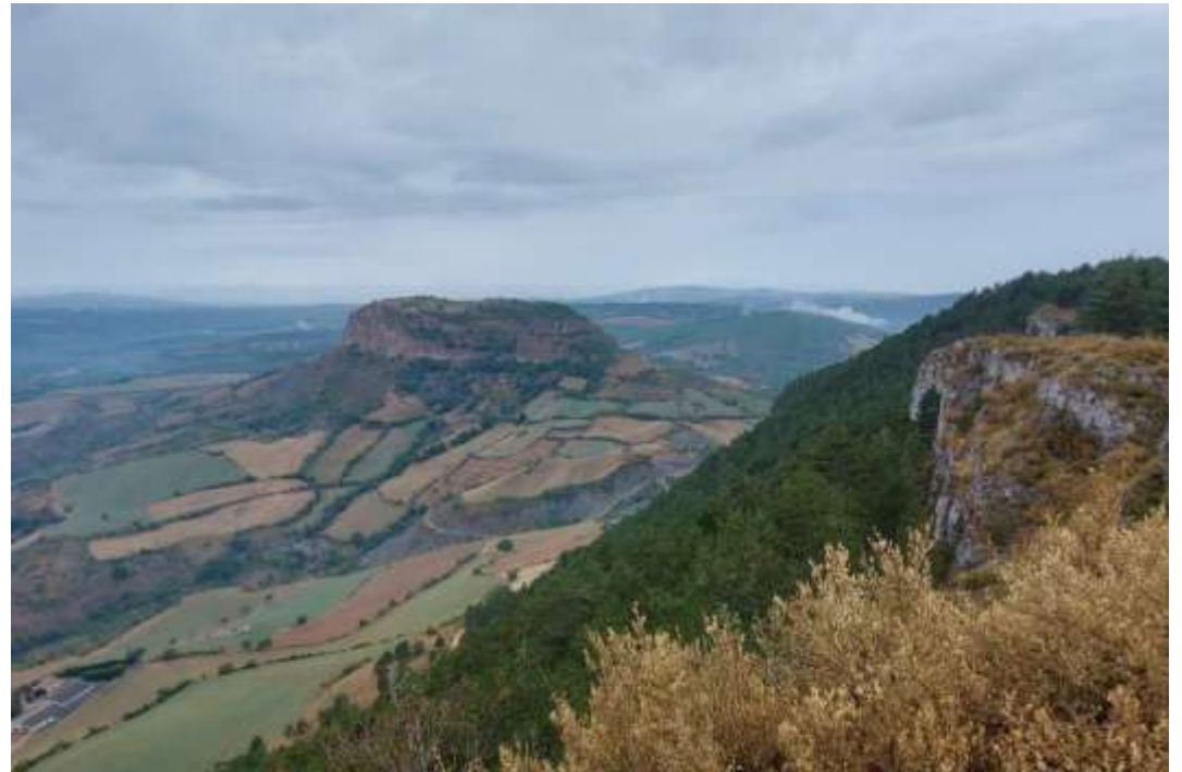
Uitzichten bij de wandeling en het gedenkteken boven de ruïne de la Chateau de Peyrelade,