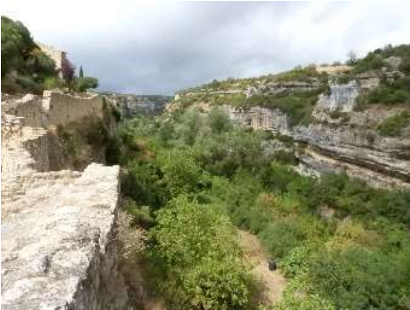
Diepe kloof rond Minerve van rivier de Briant

De paus riep daardoor de kruistochten uit en hierbij werden steden en cultuur van Zuid-Frankrijk verwoest. In Minerve werden na 5 weken belegering, alle 180 aanwezige Katharen op het plein voor het stadhuis terechtgesteld.