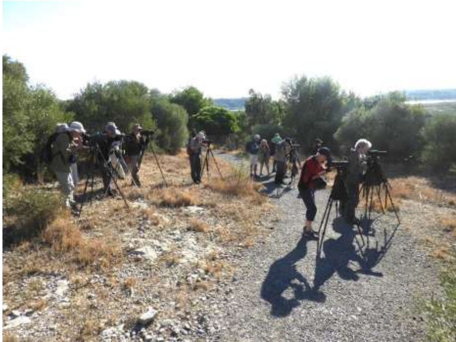
Groepsfoto Roc de Conilhac

Om 09 uur rijden we met 8 deelnemers via het smalle landweggetje Chemin du Carboules naar de Roc de Conilhac ( 7 km).