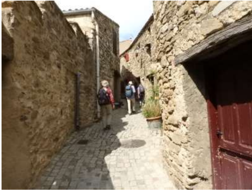
Sfeervol dorpje Minerve.....