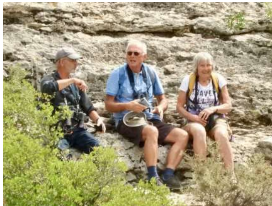
Deel van de groep ging een andere route volgen.....