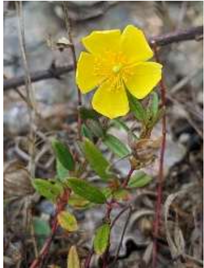
Helianthemum nummularium / Geel zonneroosje