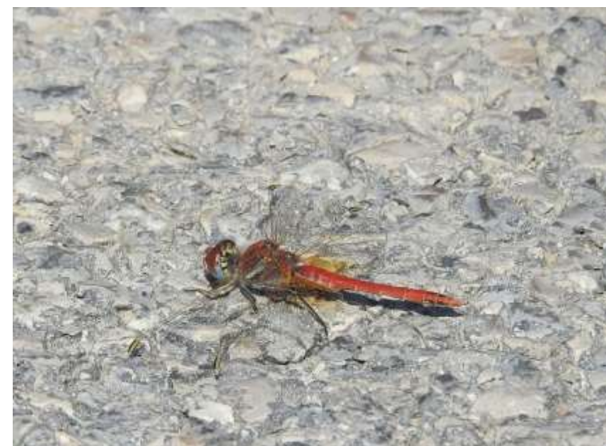
Zwervende heidelibel