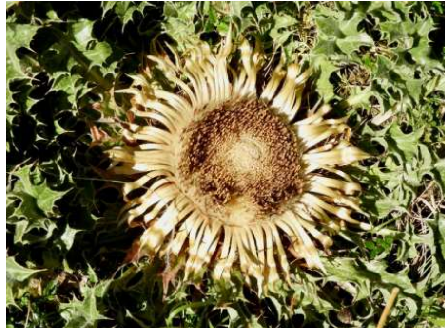
Bloeiende Carlina acanthifolia