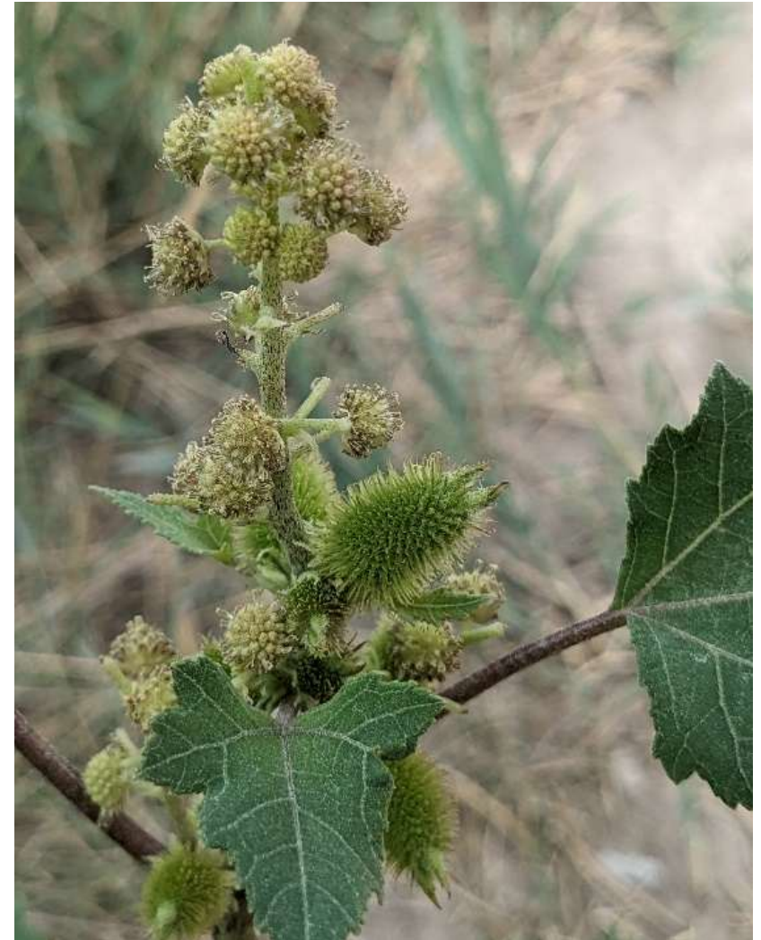
Xanthium strumarium / Late stekelnoot