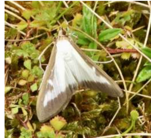
Buxusmot