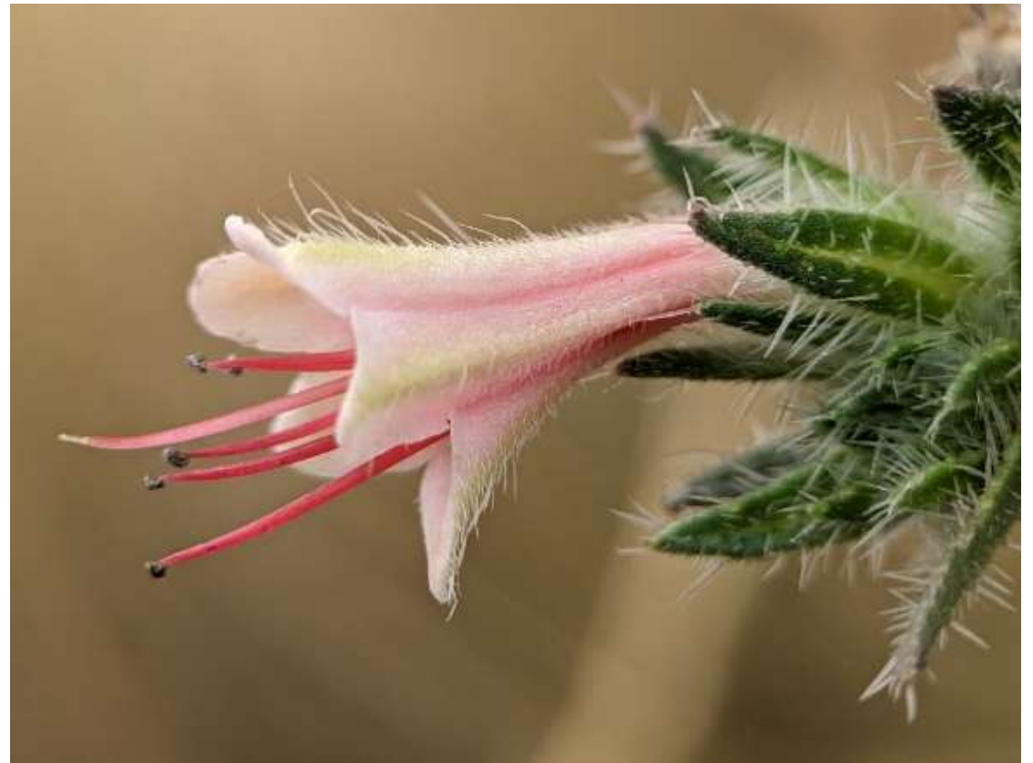
Echium asperrimum