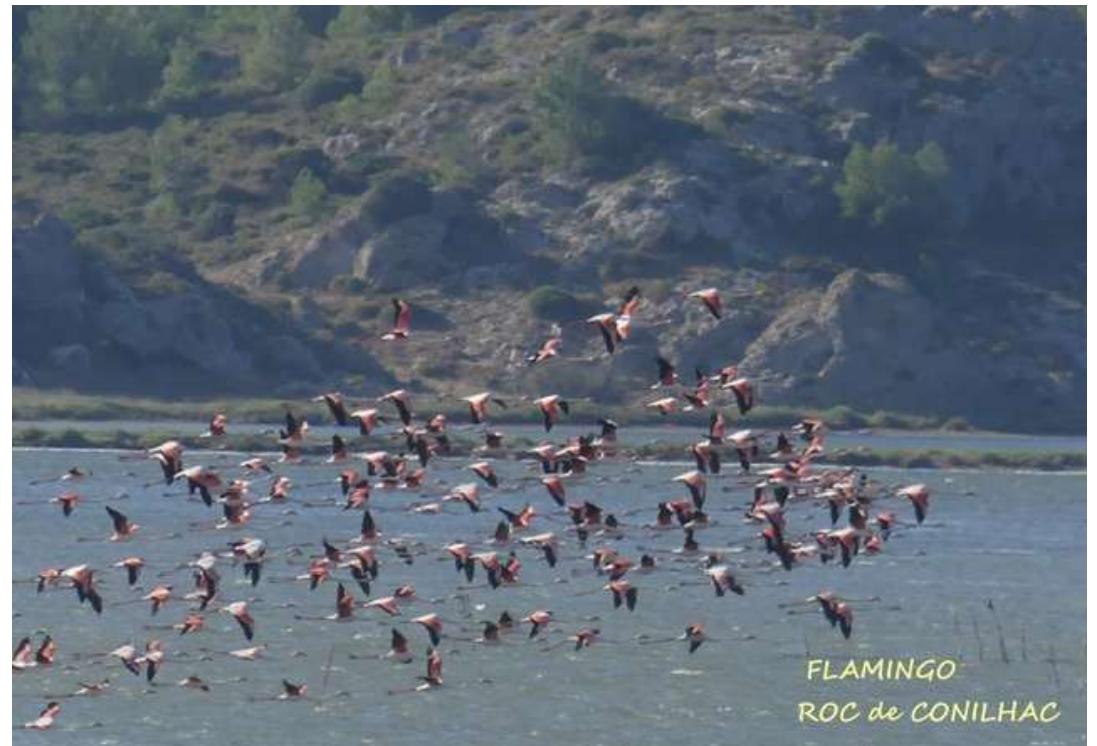
Flamingo's

Aldaar staan enkele auto's, maar wij kunnen ook parkeren. Na het determineren van enkele kwelderplanten lopen we naar het 20 m hoge plateau. Het waait er stevig, WNW, en het is moeilijk de kijker stabiel te houden. Er staan een tiental tellers en watchers en er komt al direct een cluster Wespddieven overvliegen, gevolgd door een Zwarte Wouw en een Slangenarend. Al snel zakken we af naar de luwe zijde van de heuvel om over de wetlands uit te kijken. We zien groepen Flamingo's, een groep roze Pelikanen (in 2003 zag ik er hier twee, "ontsnapt uit een wildpark"), Reigers, Sperwers, Kiekendieven en een Visarend.