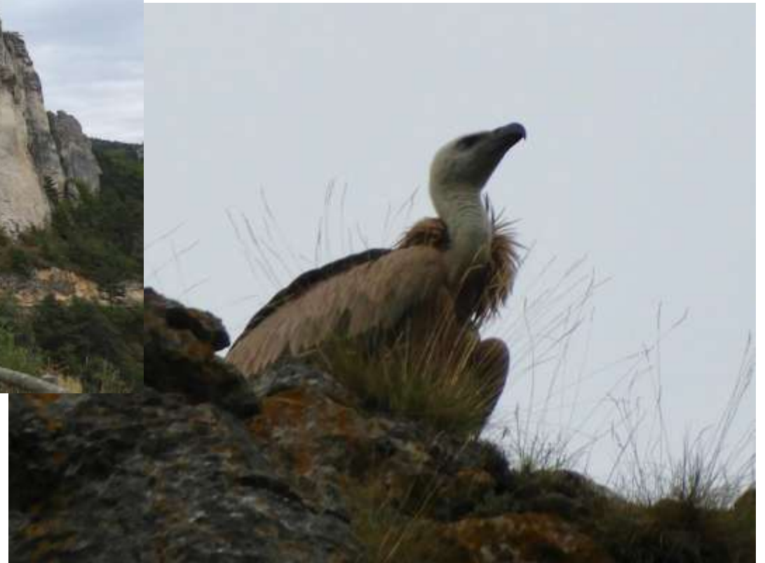
Vale Gier