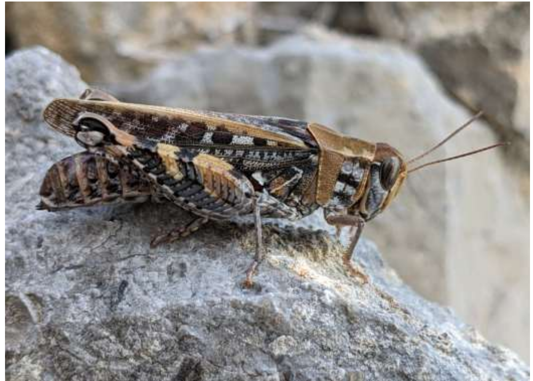
Callipyttamus spec.