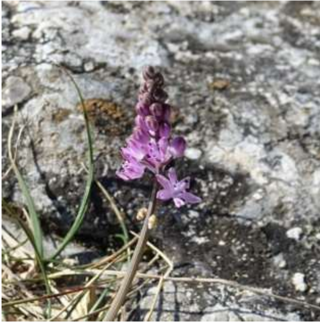
Scilla autumnalis