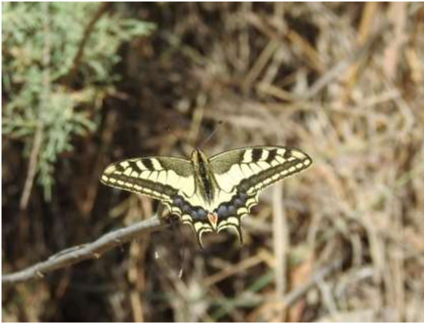
Foto André en Muriel Koninginnepage wandeling Domaine le Grand Castelou