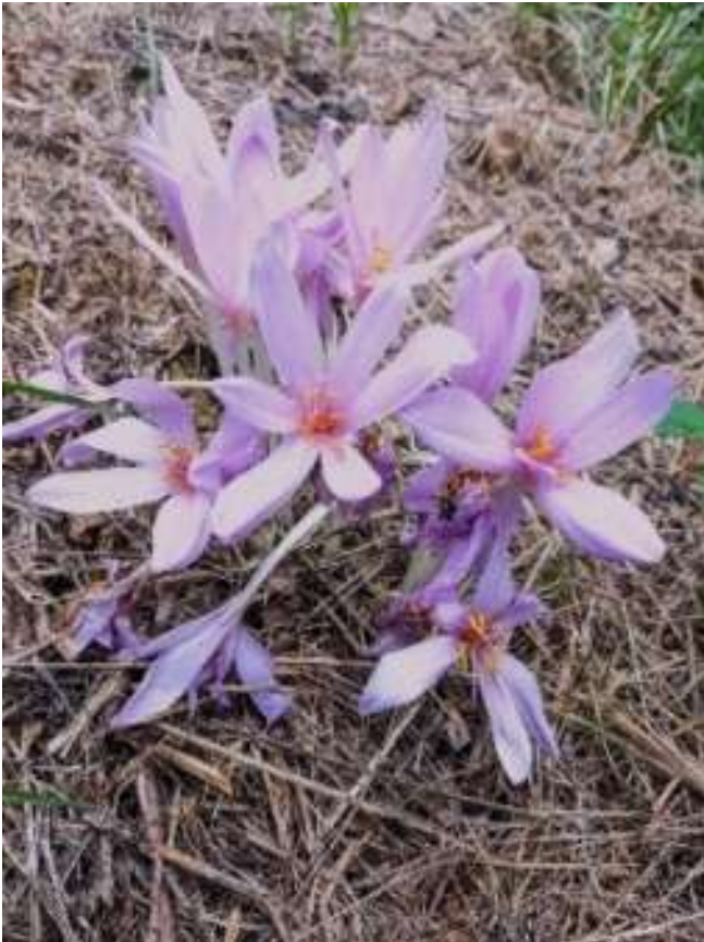
Colchicum autumnale / Herfsttijloos

3 deelnemers, \frac{3}{4} dag met auto en te voet; planten en vogels; waardering 7