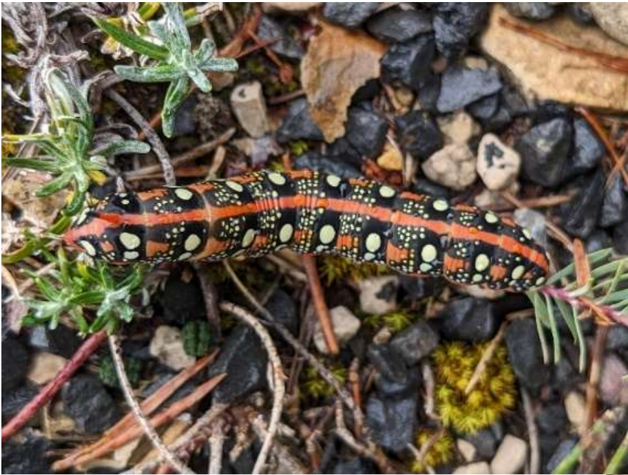
Hyles euphorbiae / Wolfsmelkpijlstaart