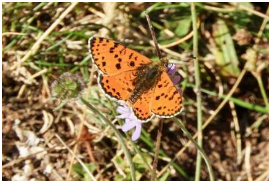
Tweekleurige parelmoervlinder