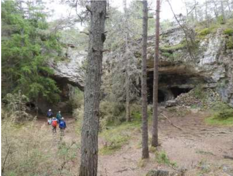
Weg met boog en rechts een rotswoning

Een in meerdere opzichten interessante wandeling.