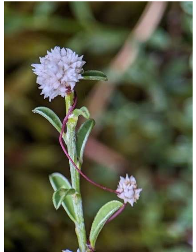
Cuscuta epithymum / Klein warkruid