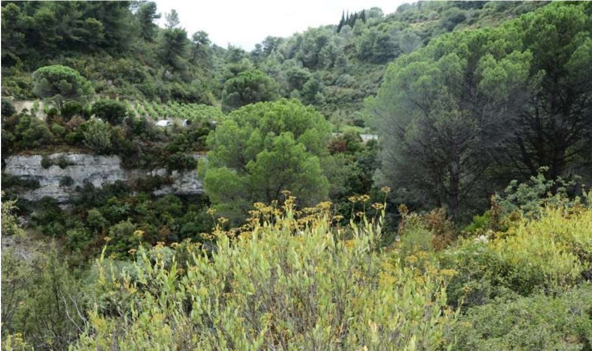
Landschap bij Minerve, met op voorgrond de struikvormige goudscherm Bupleurum fruticosum

Een klein groepje vertrok om 9.00 uur om eerst nog bij de Roc de Conilhac naar de vogeltrek te kijken.