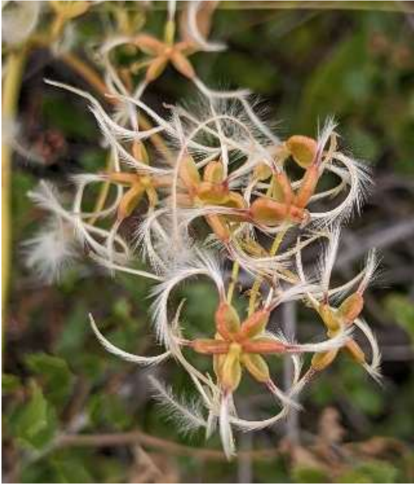
Clematis flammula / Welriekende bosrank