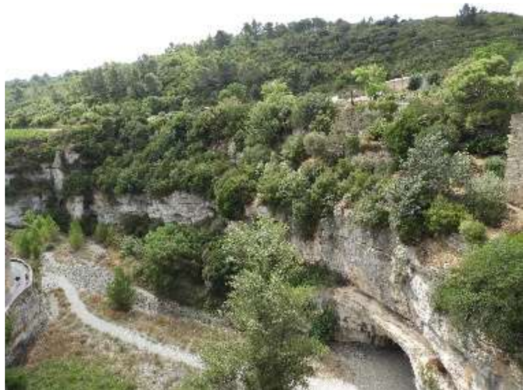
Diepe kloof van rivier de Cesse met rechtsonder een natuurlijke onderdoorgang

Het dorpje ligt op een plateau omgeven door diepe kloven van 2 samenkomende rivieren namelijk de Cesse en de Briant. De Cesse heeft een bijzondere onderdoorgang gemaakt van 200m, waarin je in de zomer kunt lopen. Voor het parkeren kun je het beste doorrijden tot je op een betaalde parkeerplaats komt, vanwaar je langs een diepe kloof naar het dorpje loopt. In deze kloof vlogen de Roodstuitzwaluwen en bij de stenen brug zagen we de Blauwe Rotslijster.