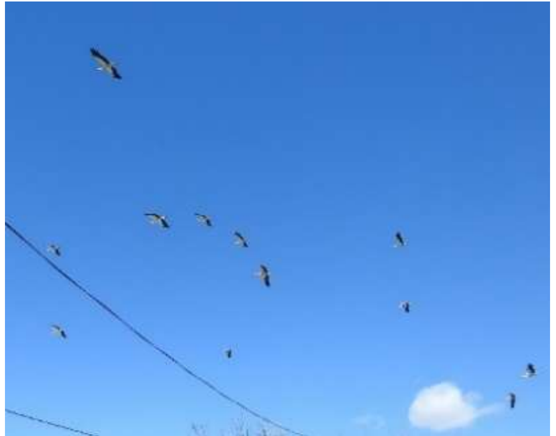
Foto André en Muriel Ooievaars op trek wandeling Domaine le Grand Castelou