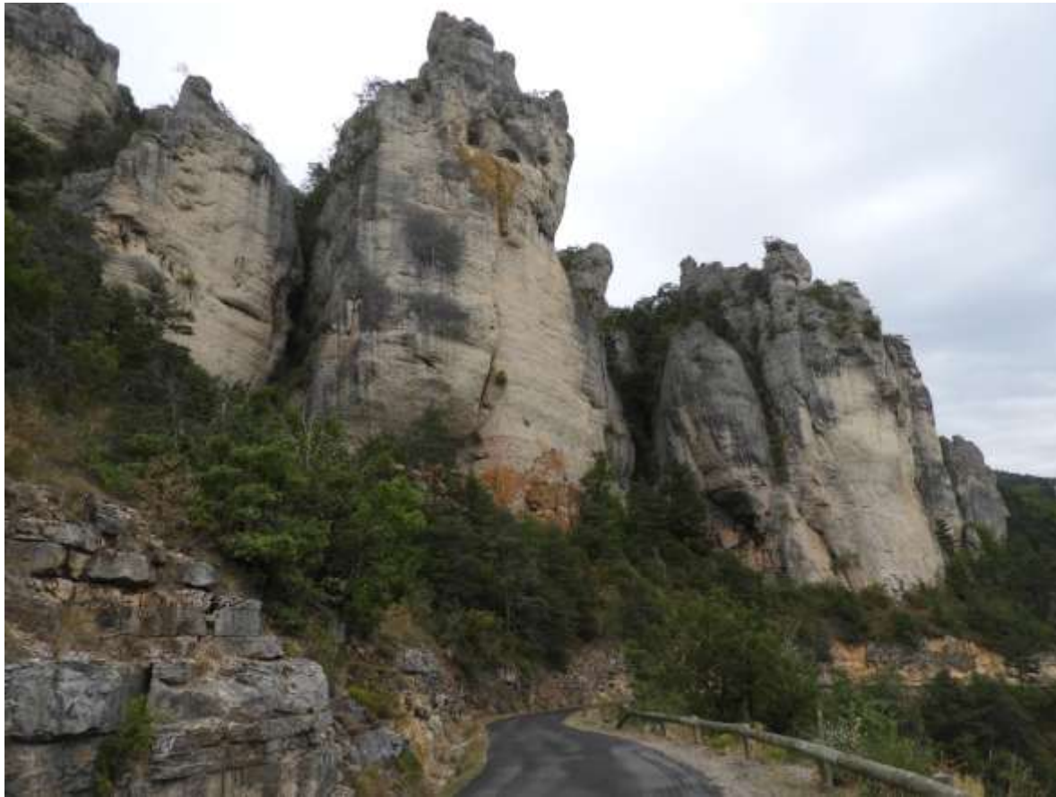
Rotswand met Vale Gieren langs de Tarn