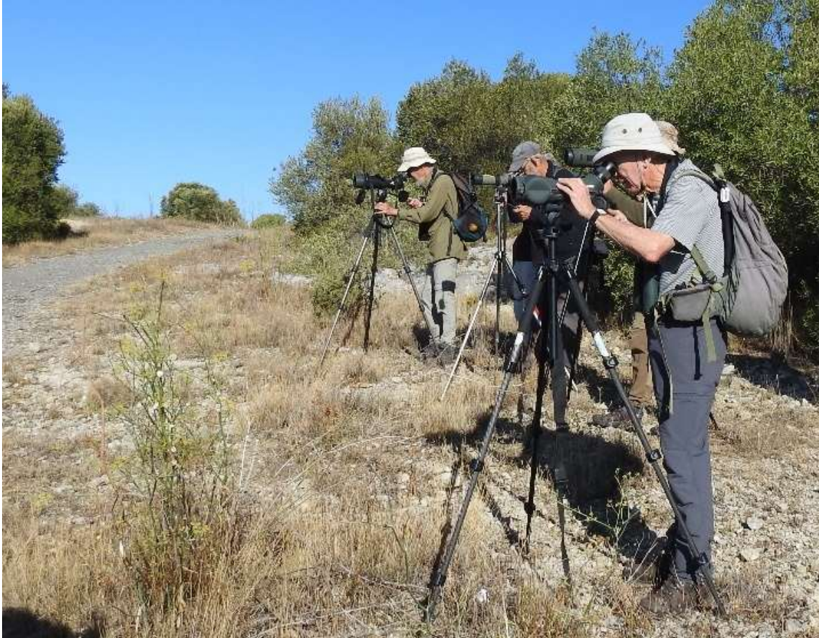
Groepsfoto excursie Roc de Conilhac