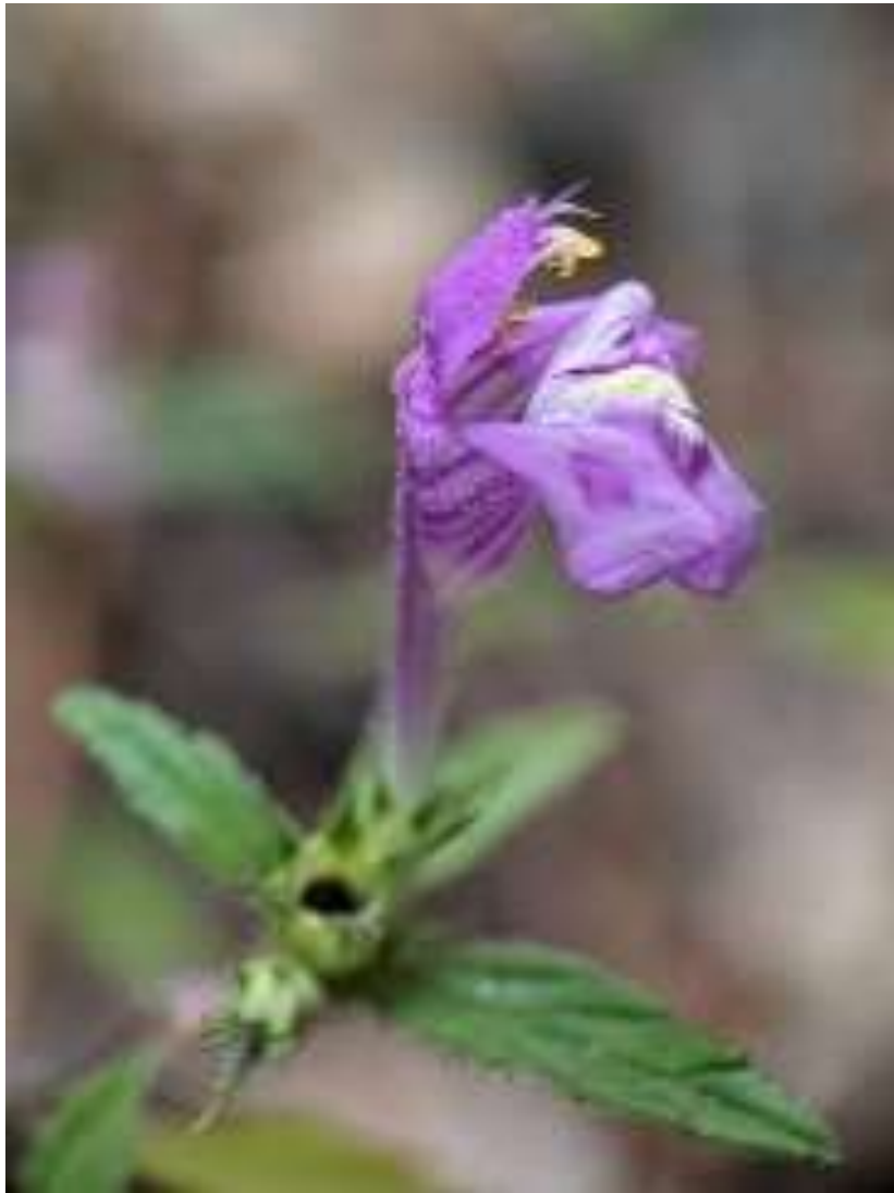
Galeopsis ladanum / Brede raai