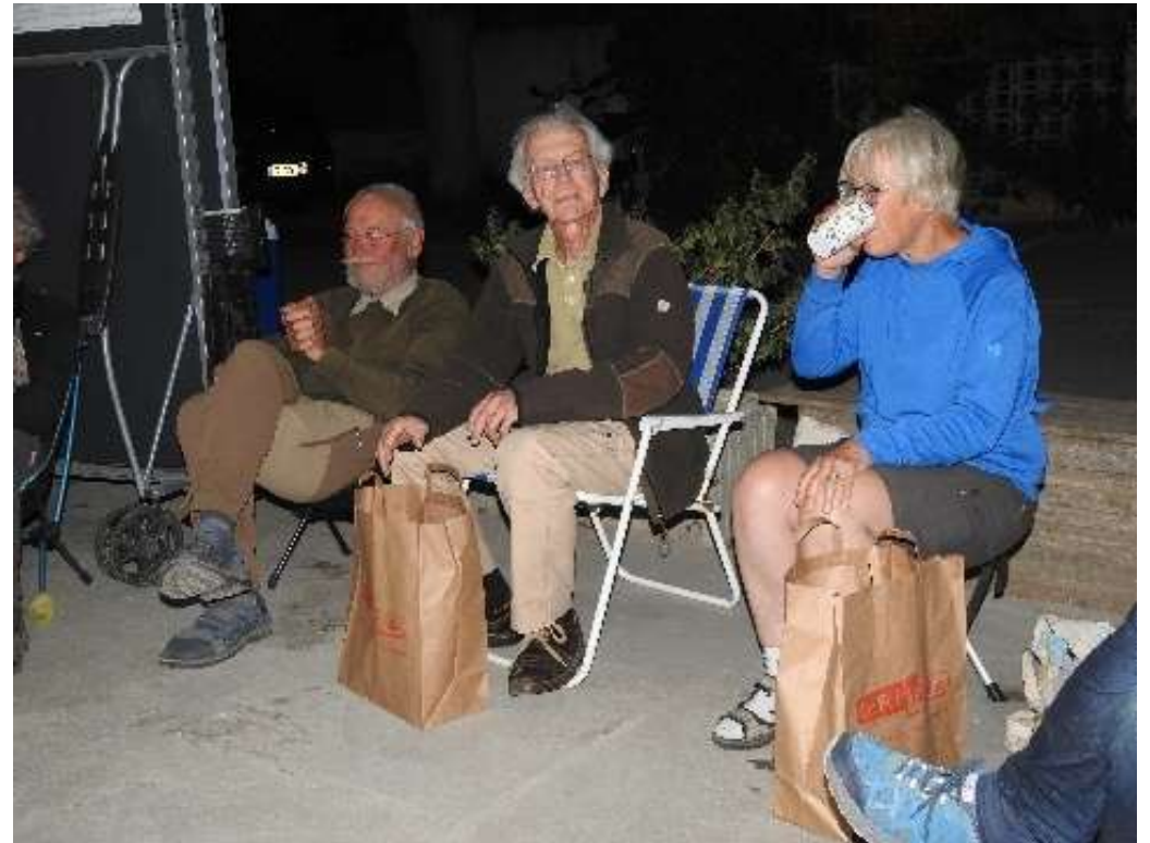
Sfeerplaatjes van de laatste kring