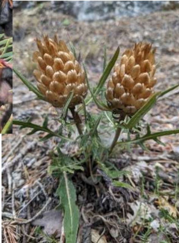
Rhaponticum coniferum