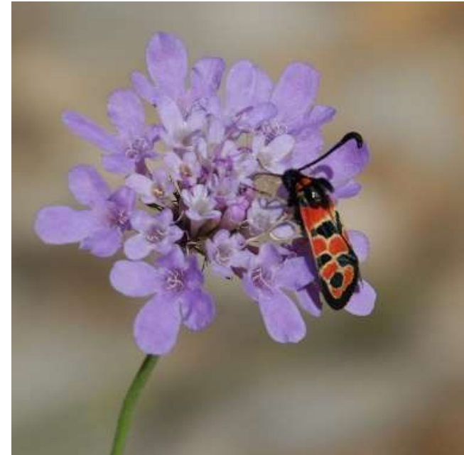
Bloeddropje / Zygaena fausta