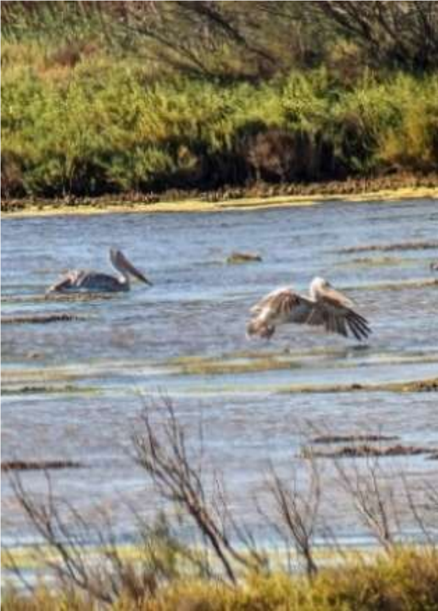
Pelikaan Roc de Conilhac