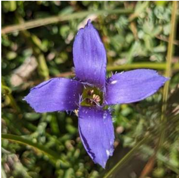
Gentianopsis ciliata / Franjgentiaan