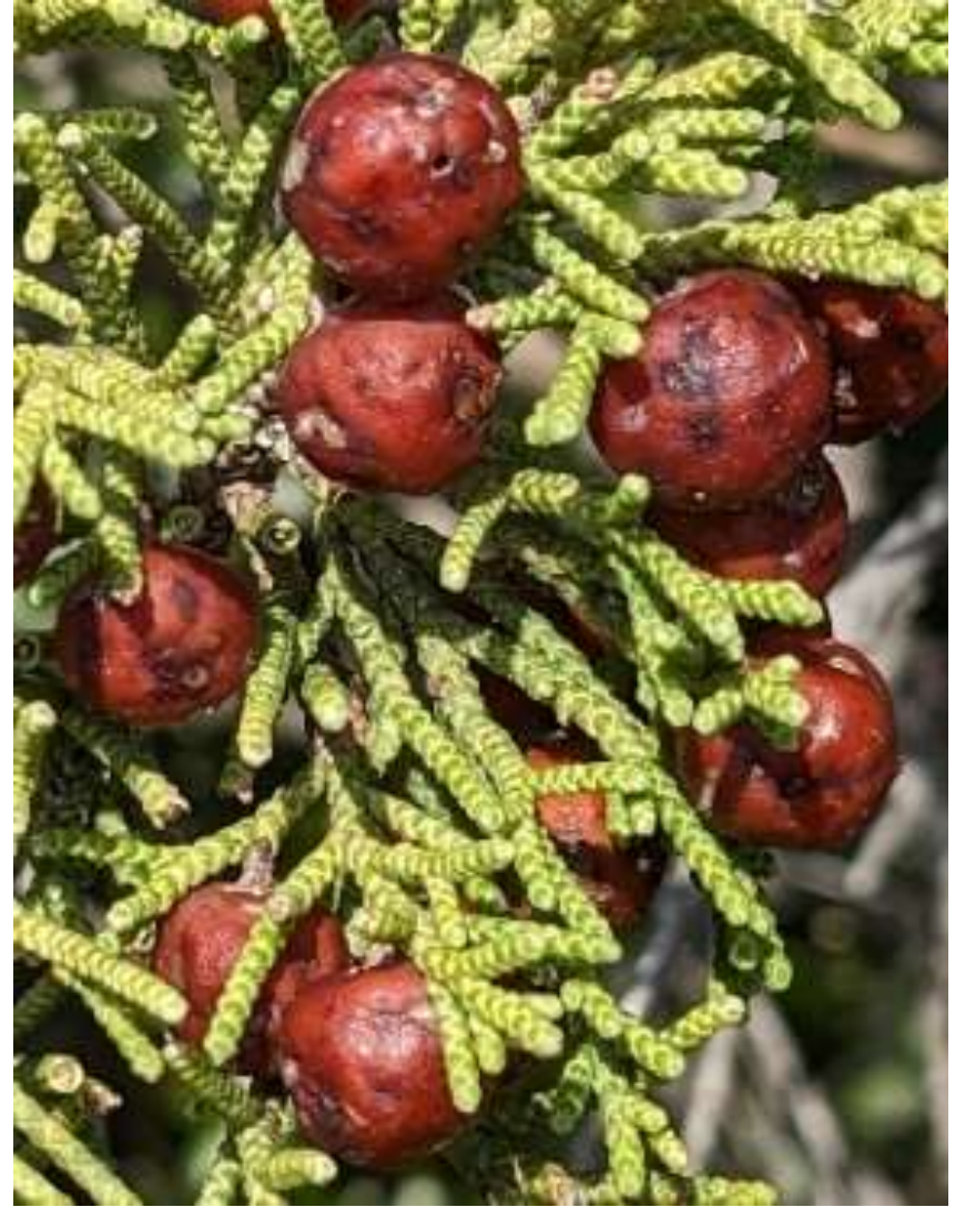
Juniperus phoenicea / Fenicische jeneverbes