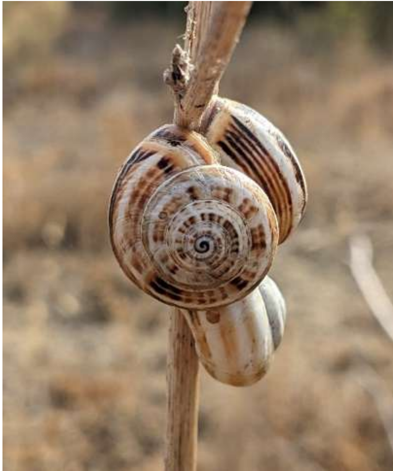
Theba pisana / Zandslak