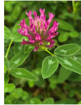
Keizersmantel, Kegelblijvlieg op Schaduwkruid en Bochtige klaver