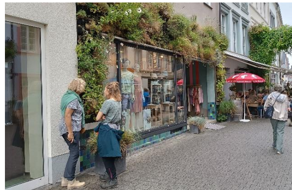
Een beetje KNNV-er is ook in de stad zo weer met natuur bezig