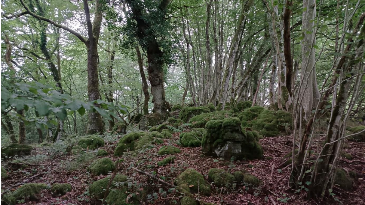
Mossige natuur halverwege de wandeling