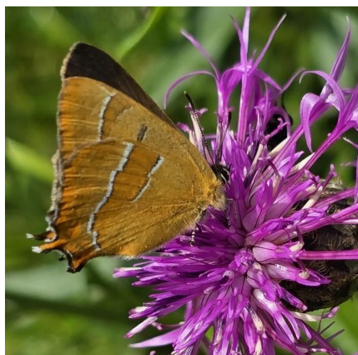
Lederboktor en Sleedoornpage