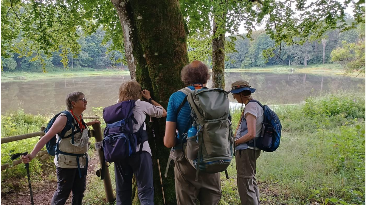
Mos en korstmoss determinatie met op de achtergrond de Windsborn krater.