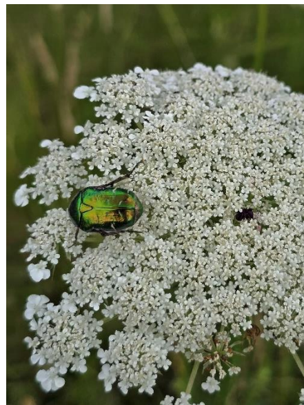
De schermbloemen trokken vele insecten zoals de Slanke driehoekzweefvlieg, Moeraszweefvlieg, Moerasdriestip en Gouden tor

C. (Anke): het Maarmuseum in Manderscheid opent in de middag en is een bezoekje waard.