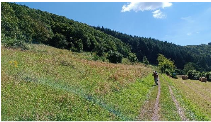
Hellingen vol bloeiende planten en vele vlinders

De wandeling is een rondgang rond de Maar (oude krater gevuld met water). We zijn laag gestart waar we in de berm en vele soorten vlinders tegenkwamen. Daarna liepen we door het dorpje omhoog en liepen bovenlangs terug. Een stukje klimmen maar via de uitkijktoren had je dan een prachtig uitzicht over de Maar. (zie foto boven de inhoud).