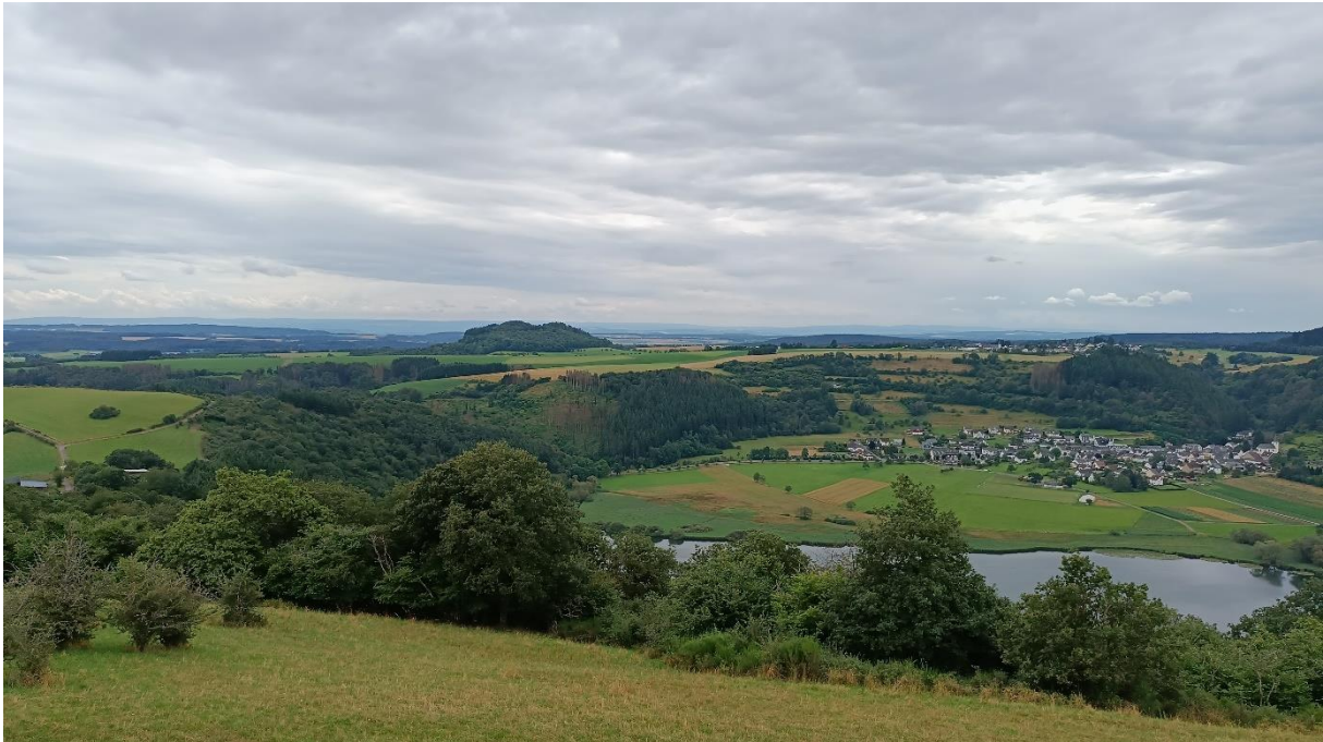
Uitzicht over Meerfelder Maar