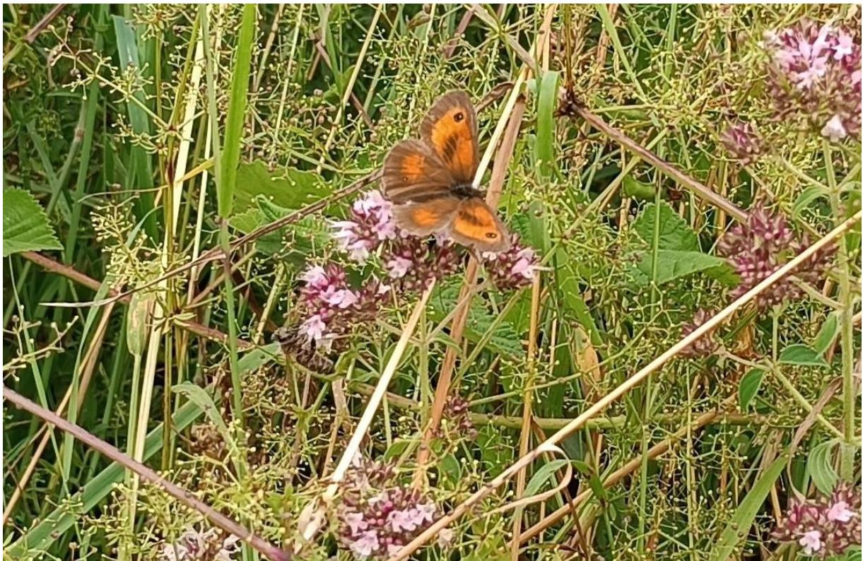
Deze kwamen we vaak tegen: het oranje zandoogje en wilde marjolein