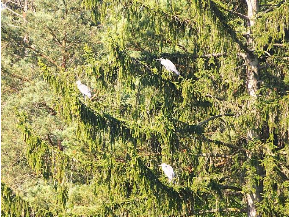
De wandeling startte met 3 blauwe reigers in een spar