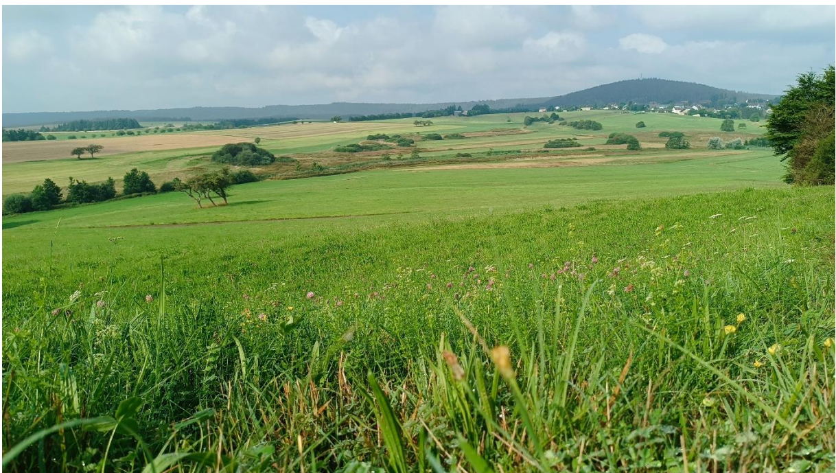
Uitzicht vanaf de Mosenberg: kruidenrijk grasland