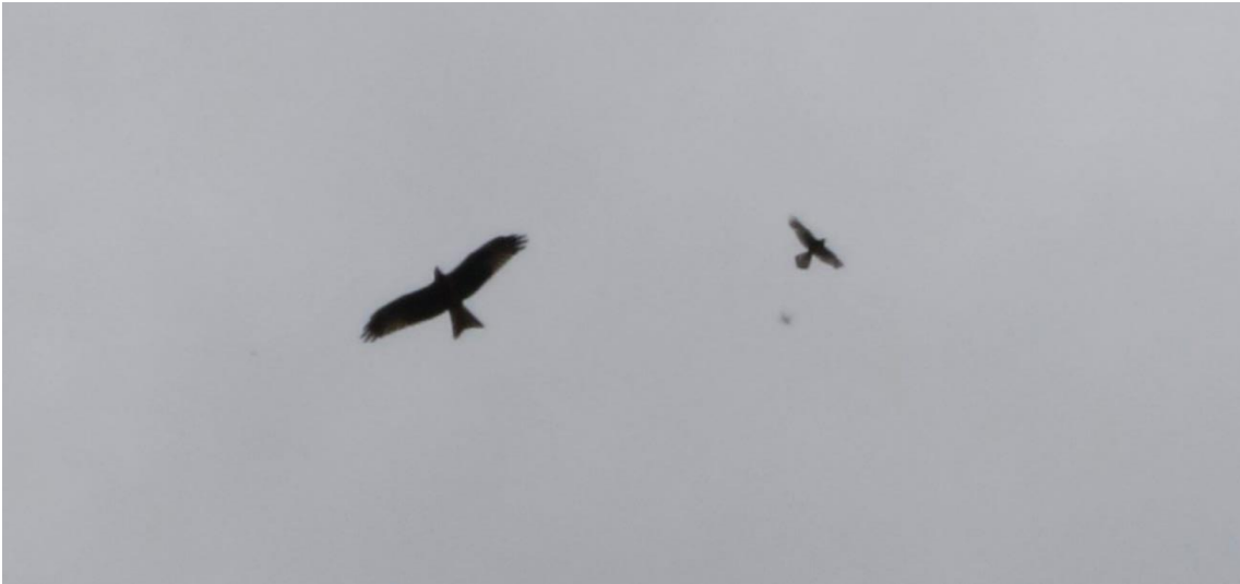
Rode wouw met kenmerkende staart met V-vorm en Torenavalk

wandeling staat beschreven in het boekje Die Pflanzenwelt der Eifel van Hermann Bothe. Er is een kleine parkeerplek iets ten noorden van Nonnenbach, de Parkplatz Seidenbachtal. Het gebied ligt in de Blankenheimer Kalkmulde. De kern van het gebied wordt gevormd door een groepje halfdroge graslanden op de Froschberg. Wij zijn vanaf het parkeerterreintje meteen de Froschberg opgelopen en werden verrast door een overdaad aan kalkplanten. De graslandjes mogen alleen via de uitgezette "Trampelpfade" betreden worden, deze bieden ruim voldoende gelegenheid tot het bekijken van de vegetatie. Na de Froschberg is de rest van de wandeling, die we in omgekeerde richting hebben doorlopen, een beetje een lauw nawasje. Al met al zeer de moeite en de lange autotocht waard.