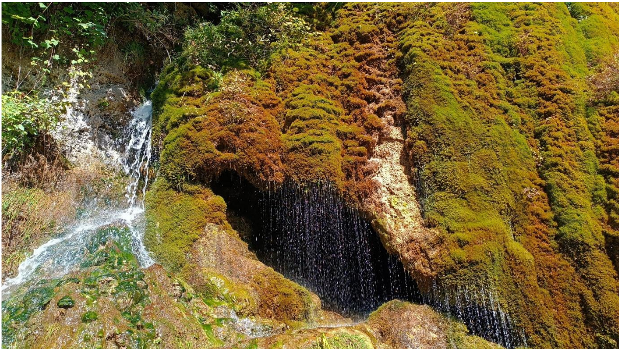
Verschillende tinten mos bij de Dreimühlen wasserfall

B. (Jacques): Excursie naar het Nonnenbachtal