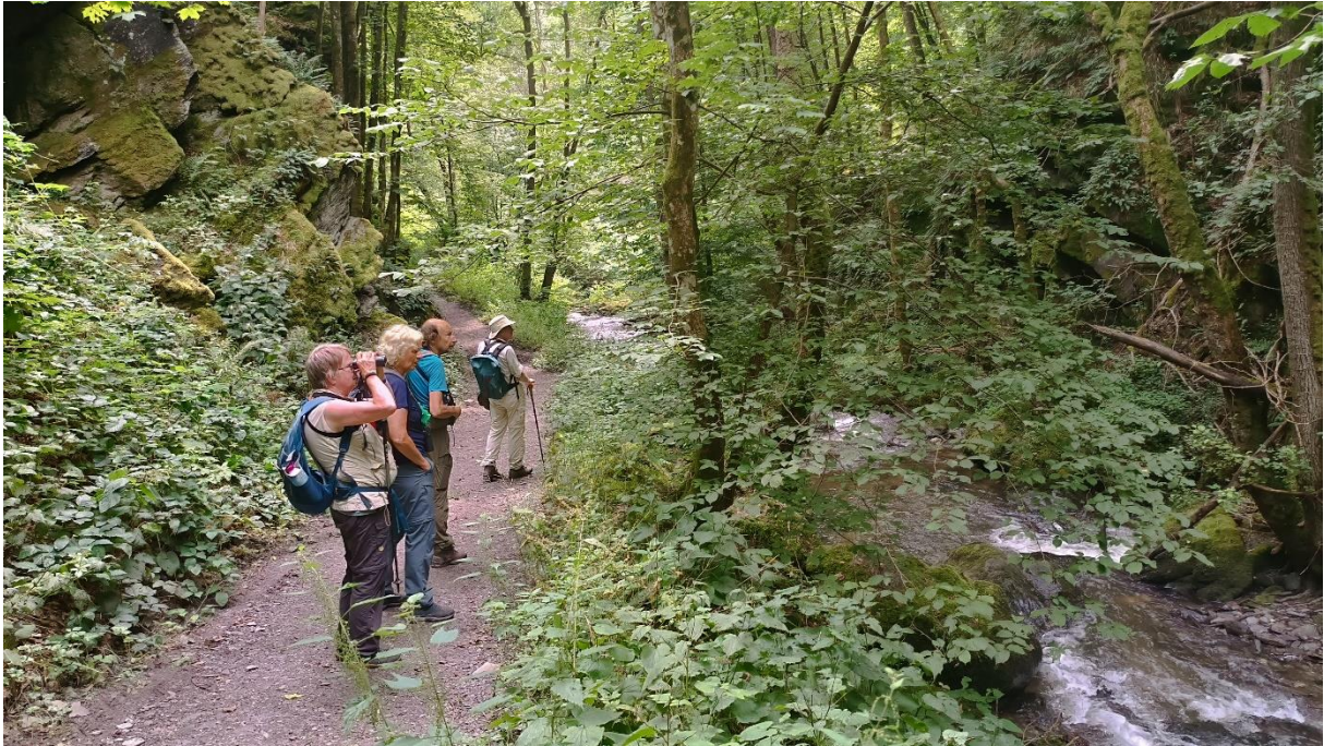
Prachtig wandelgebied in perfect biotoop voor de waterspreeuw die hier ook werd ontdekt!