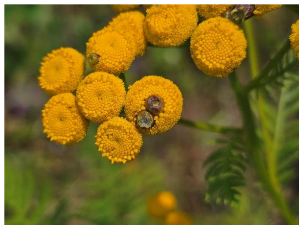
Wilde cichorei en gallen van de gewone boerenwormkruidgalmug