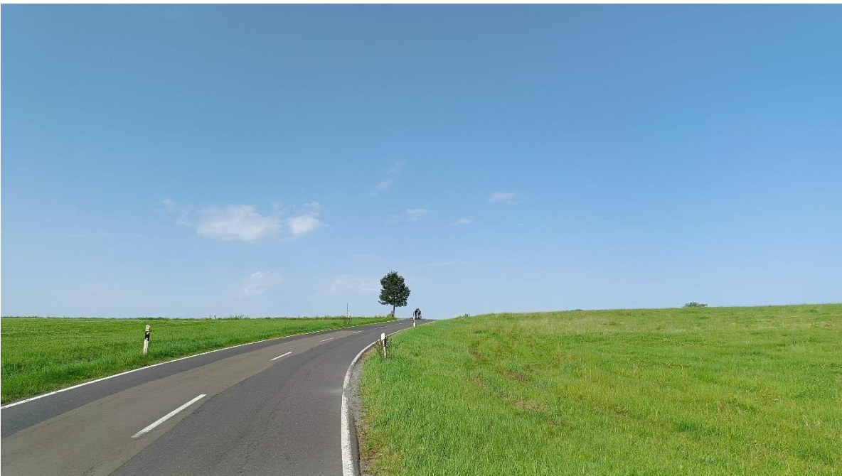
De Eifel is ook heel geschikt voor de (sportieve) fietser