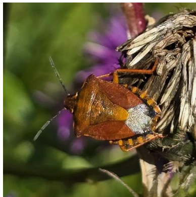
Alpenbergglas met Bergglaswants en Knoopkruid met Knoopkruidschildwants