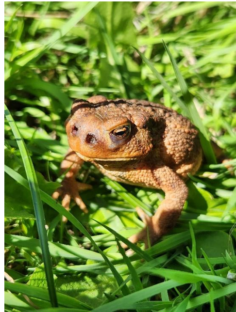
Een pad geïnfecteerd met de paddenziekte myiasis

Kom je een zieke pad tegen: deze kan je melden op ziektes@ravon.nl , graag met foto en locatie.