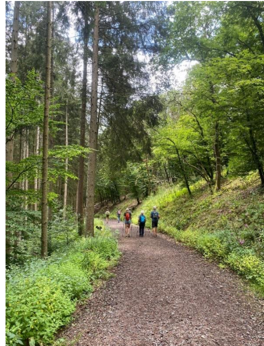
Burchten en goed begaanbare paden met veel lichtgroen

B. (Jacques): We zijn met een auto en vijf mensen vertrokken richting Gillenfeld. Er zijn daar in de buurt vier maaren waarvan er twee vooral landschappelijk leuk zijn, het Pulvermaar en het Holzmaar, de twee anderen het Dürres Maar en het Strohnner Märchen zouden botanisch erg interessant zijn. We besloten ons te concentreren op de laatste twee en de andere van een afstand gade te slaan, hetgeen een goede keus bleek. Voor het Dürres Maar parkeerden we de auto op de Wanderparkplatz Holzmaar. Van daaruit is het nog een stukje lopen door een loofbos om vervolgens uit te komen bij het verlandde maar. Het maar was redelijk interessant, de planten in de buurt ook, zo vonden we bij de lunchplek een Vogelnestje in bloei. Het volgende maar, het Strohnner Märchen was met de auto niet goed te bereiken. Deze hebben we achter ons gelaten op de weg die vanuit de L16 richting het maar gaat. Van daaruit was het nog een redelijke afstand lopen. Het Strohnner Märchen is behoorlijk verland en is botanisch bijzonder interessant. Er was onder andere lavendelheide te bewonderen, wel met een verrekijker, maar dat kon de pret niet drukken. Al met al een zeer geslaagde excursie.