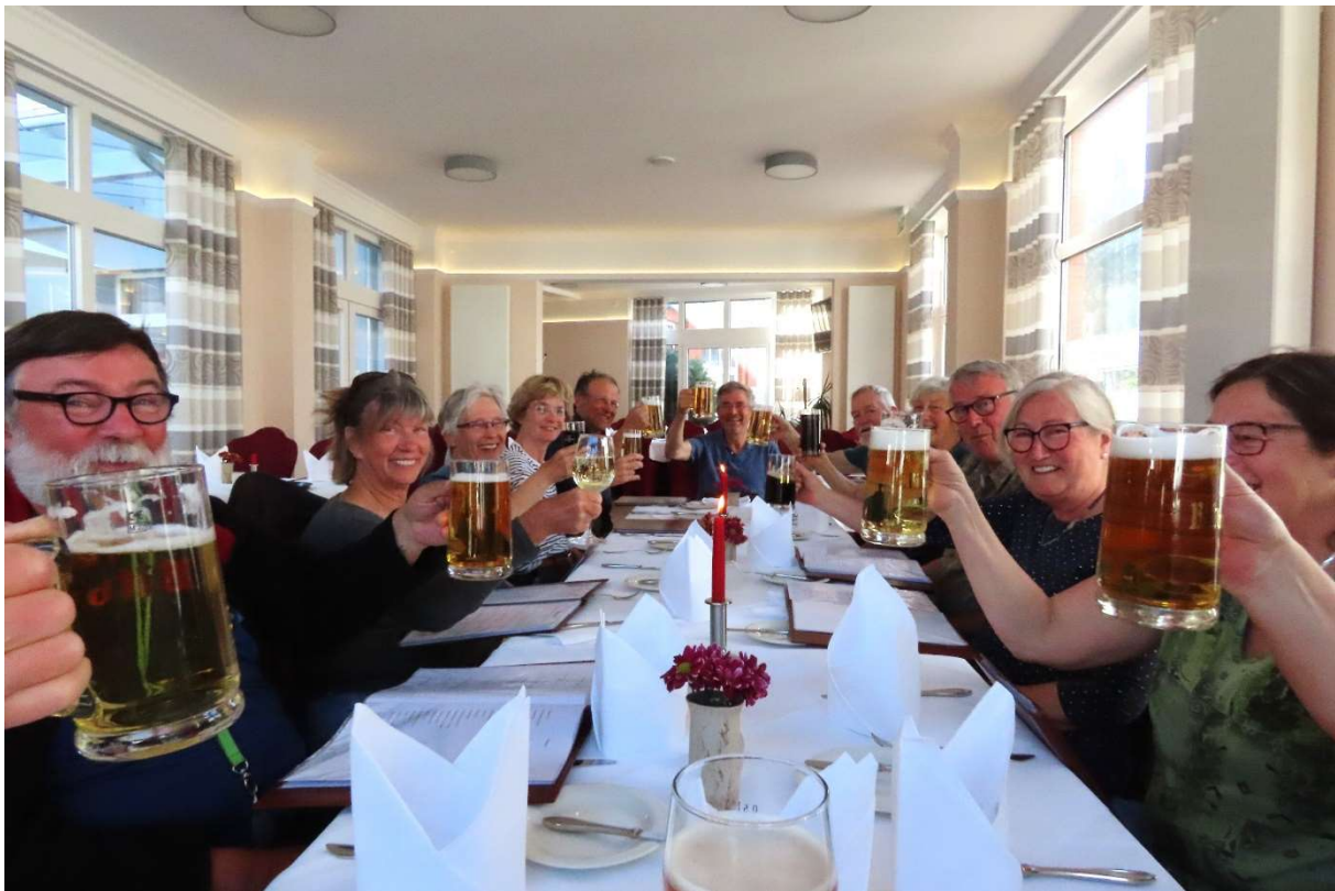
Afscheidsdiner in Tangermunde

We reden met de auto 13 km naar startpunt #3 van de Bergetour, Milow. Parkeer de auto bij de begraafplaats. We liepen het kleinste rondje van de 3? wandelingen. De route ging helling op door een bos en kwam uit op een hoog punt met uitzicht op Rathenow. De Acacia's bloeien uitbundig. Op de zuidhelling van dit hoge punt groeit een interessante flora, Slangenkruid, en diverse vlinders. We liepen rechtsom via een steile zandhelling naar beneden. Daar is wat water, we hoorden een Sprinkhaanzanger. Daarna reden we naar het bezoekerscentrum waar we ons verbaasden en verheugden over de creativiteit om biologische wonderen te leren waarnemen.