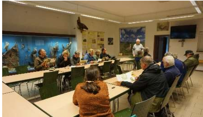
Figuur 1 Bezoekerscentrum