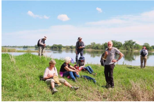
Pauze aan de Elbe

Was goed te belopen met wandelschoenen. Dit omdat het hier al lang niet meer geregend heeft. Terug naar de camping gefietst. Deze dag 18 tot 20 graden, zon, bewolkt, wind.