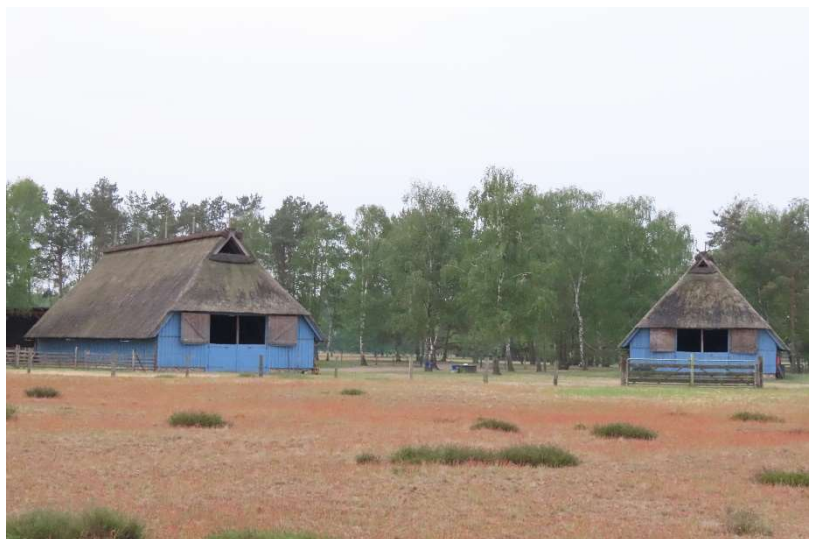
Schapenkooi Nemitzer heide