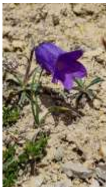
Allioni's klokje (Campanula alpestris)

Doorgereden naar de Col, op 2360 m. Hier vandaan pad naar top gevolgd. Landschappelijk zeer fraai gebied met rijk bloeiende Alpiene flora.