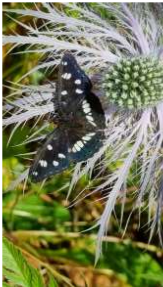
Blauwe ijsvogelvlinder op Alpenkruisdistel