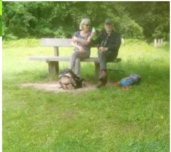
Toeschouwers bij slootje vissen

Die avond in de Kring worden de ervaringen van de dag gedeeld en net als gisteren wordt er chocolademelk geserveerd. Weliswaar koud, maar zo wordt de traditie toch een beetje in stand gehouden. Degenen die dat willen- en dat zijn er een paar – kunnen de “choc” zelf opwarmen.