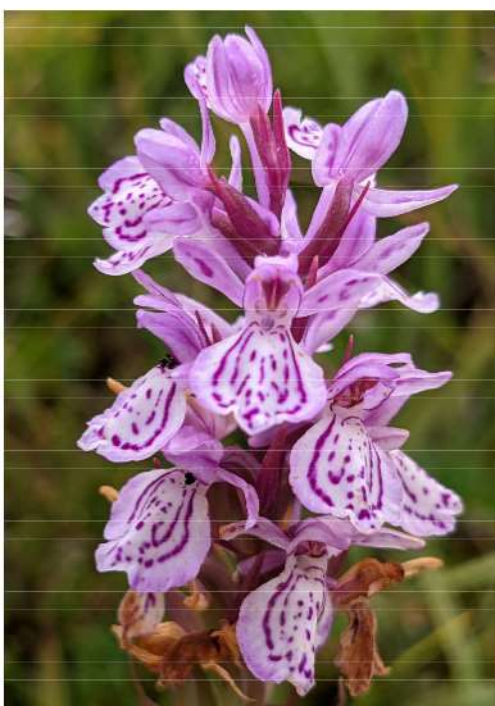
Dactyloriza maculata - gevlekte orchis.