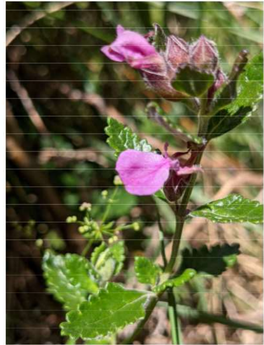
Teucrium chamaedrys -