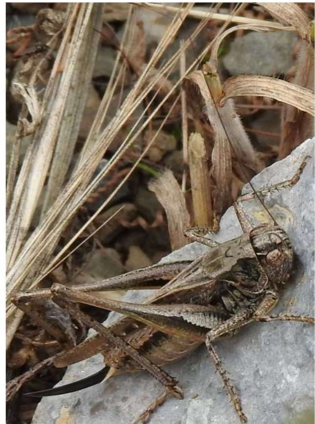
Duinsabelsprinkhaan - Platyceis albopunctata .