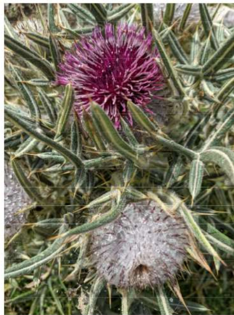
Cirsium eriophorum - wollige distel.