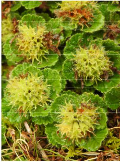
Teucrium pyrenaicum - Pyreneese gamander..