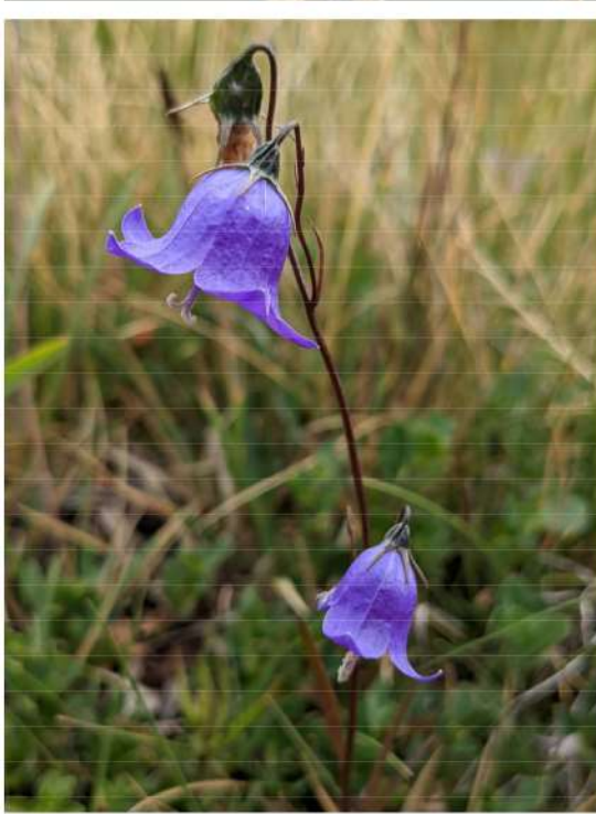
Campanula cochlearifolia - elfenvingerhoedje.