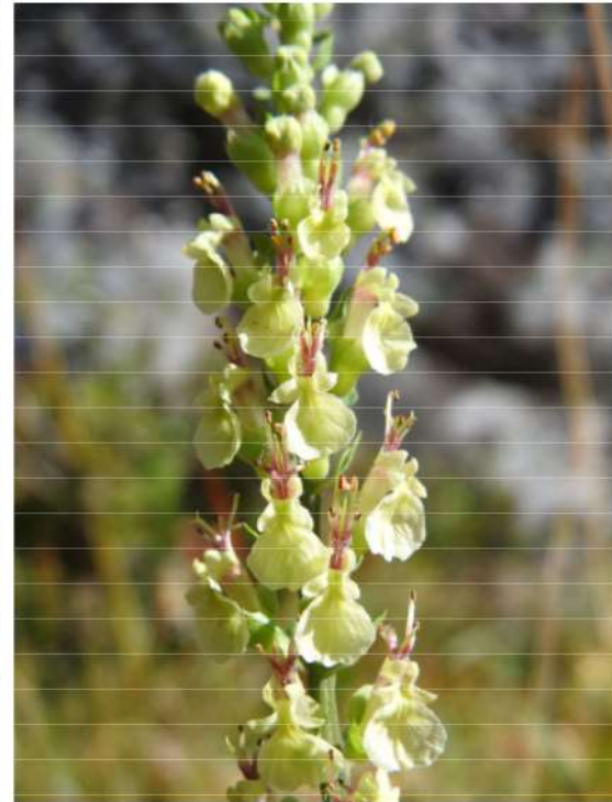
Teucrium sorodonia valse salie.