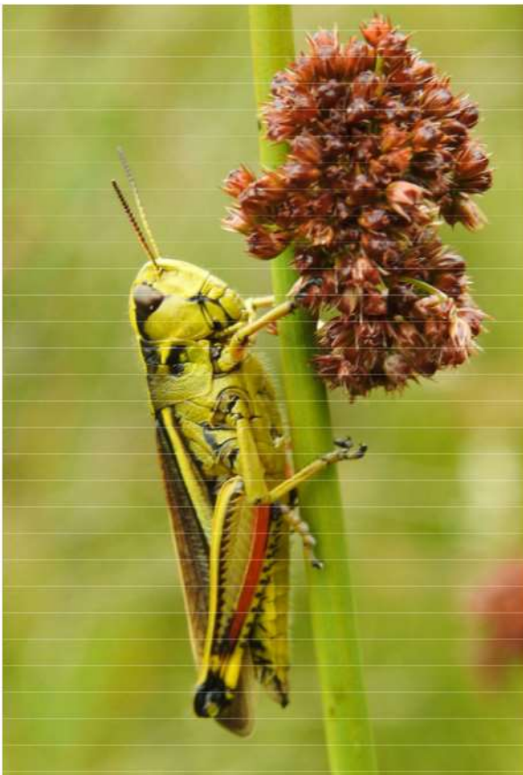
Moerassprinkhaan = Stethophyma grossum .