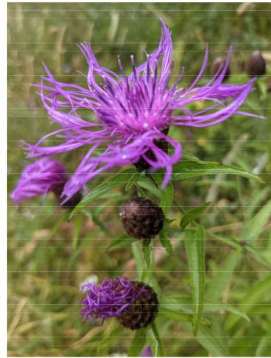
Centaurea nigra - zwart knoopkruid.