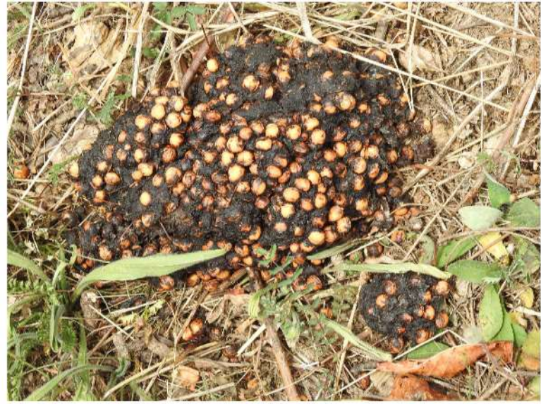
Berendrol met kersenpitten.