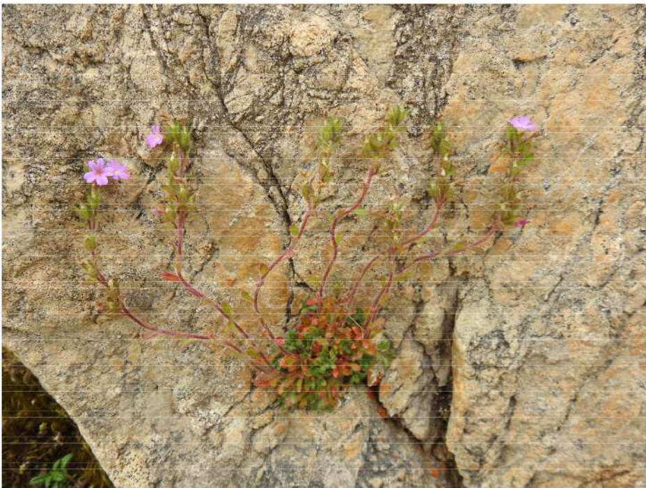
Erinus alpinus - alpenbalsum.