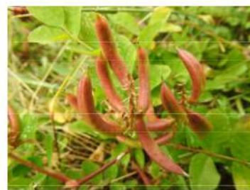
Astragalus glycyphyllos - hokjespeul.