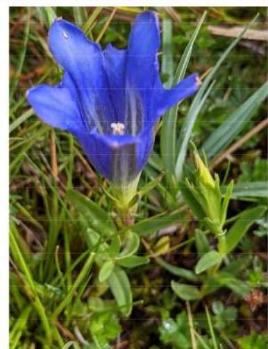
Gentiana pneumonanthe - klokjesgentiaan.