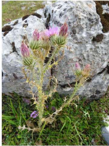
Carduus tenuiflores - tengere distel.