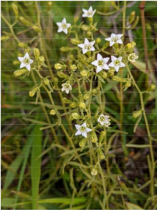
Thesium pyraeicum - weidebergvlas.