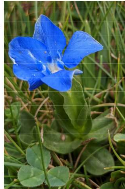
Gentiana verna - voorjaarsgentiaan.