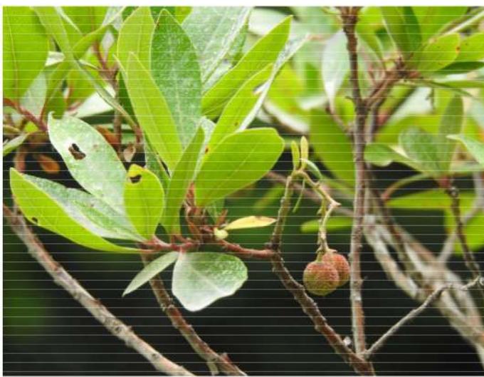
Arbutus unedo - aardbeienboom.

Hierboven was al iets te zien, hieronder volgt een strenge selectie uit Frans' foto's. Met ere zij vermeld dat Frans de meeste planten en beesten ook van een naam voorzag.