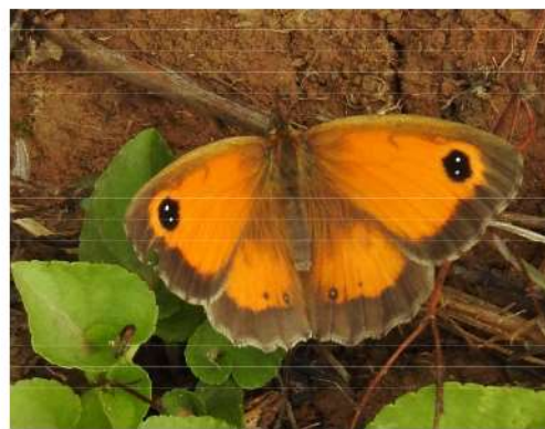
Oranje zandoog - Pyronia tithonius .