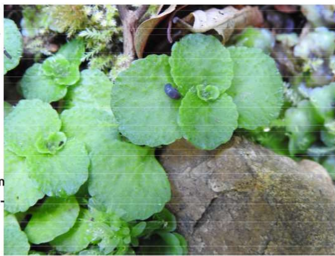
Chrysosplenium oppositifolium - paarbladig goudveil.