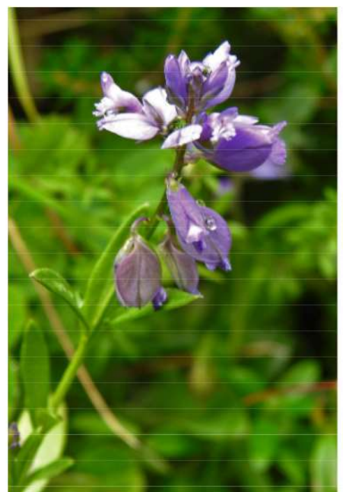
Polygala alpina - bergvleugeltjesbloem.