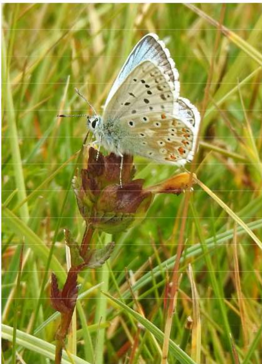
Provencaals bleek blauwtje - Lysandra hispana .