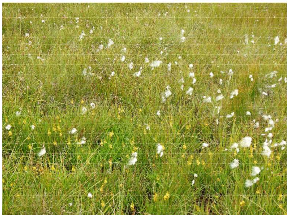
Eriophorum latifolium - breed wollegras met beenbreek.