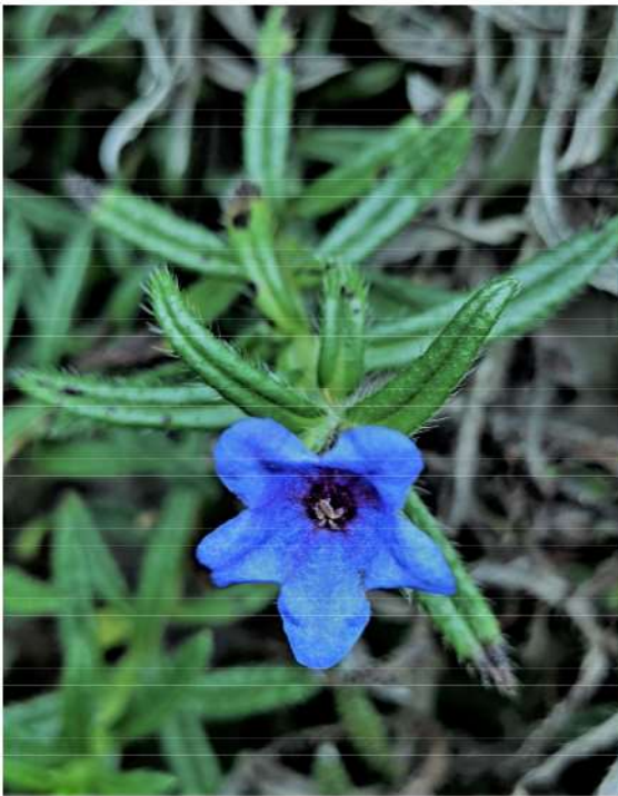
Lithospermum = Buglossoides purpurocaerulea - blauw parelzaad.