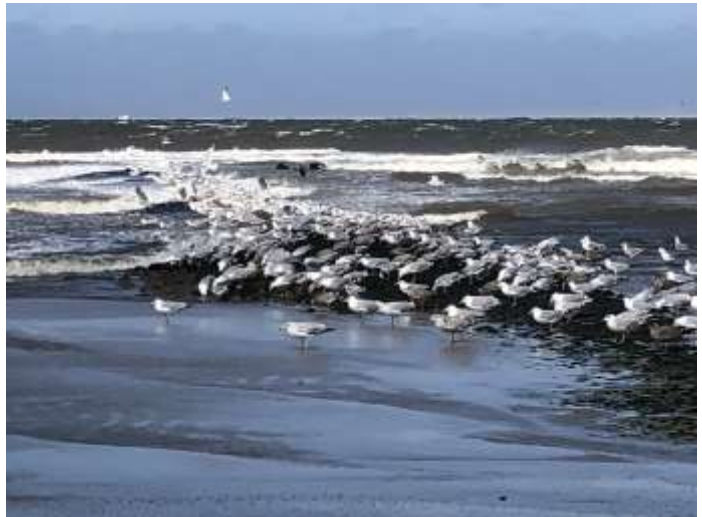
Meeuwen op een strekdam.

In de schuilplek hebben we met veel geduld een riemwier met een voetje en een Japans bessenwier uit elkaar gehaald om te laten zien hoe mooi Japans bessenwier groeit, een soort rok aan de waslijn.