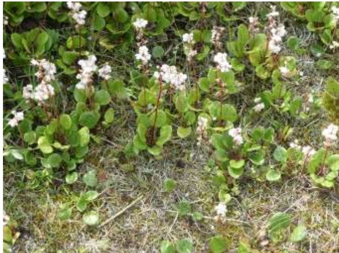
Rond wintergroen

Excursie 7. Ook de wandelaars gingen eerst een stukje fietsen, langs de Mokbaai en het fietspad tussen de beide Horsmeertjes tot het punt waar je de fietsen kon stallen en het pad onverhard verder ging.