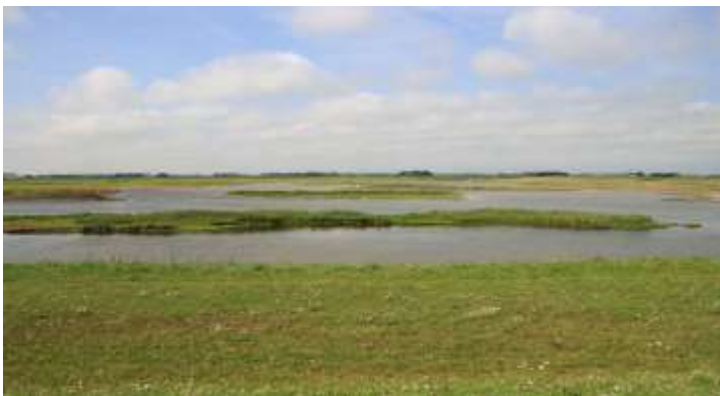
Uitzicht vanaf de Waddendijk land inwaarts.