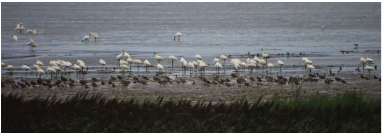
o.a. Lepelaars, wulpen en grutto's