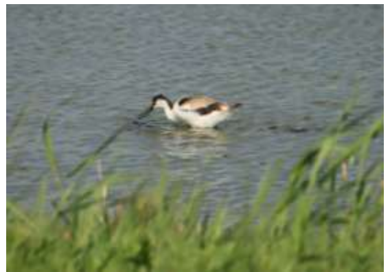
Jong van Kluut aan het foerageren