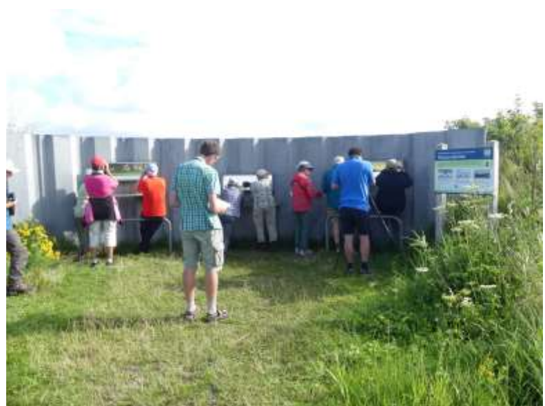
kijkscherm bij Balgzand

Er waren meerdere oud-Heldenaars onder de deelnemers (waaronder ik) en één vertelde ons dat Den Helder van alle gemeenten in Nederland het meest had geleden onder de oorlog (afgezien van Rotterdam in mei 1940). De bevolking was voor het grootste gedeelte geëvacueerd en de stad gebombardeerd.