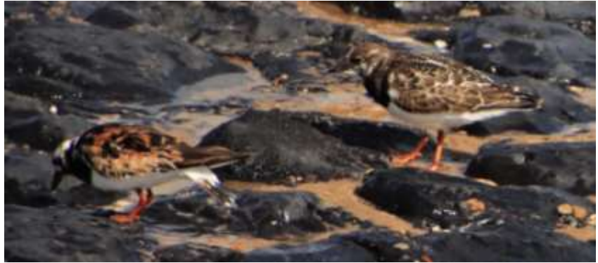
Steenlopers op de basaltblokken.

Bij fort Kijkduin dronken we koffie met taart in restaurant Storm aan Zee met prachtig uitzicht over de zee.