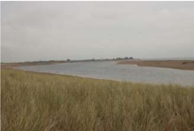
Uitzicht vanaf het nieuwe kijkscherm op de nieuwe inlaat

Op Texel aangekomen hielden we rechts aan om via de waddenkust naar boven te fietsen. Een mooi nieuw stuk duinen is daar aangelegd, met een golf-vormig vogeluitkijkpunt. Helaas weinig waarnemingen daar.