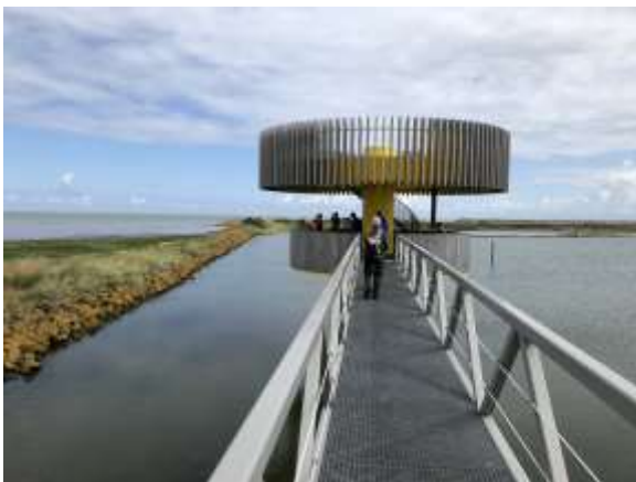
Een moderne kijktoren.