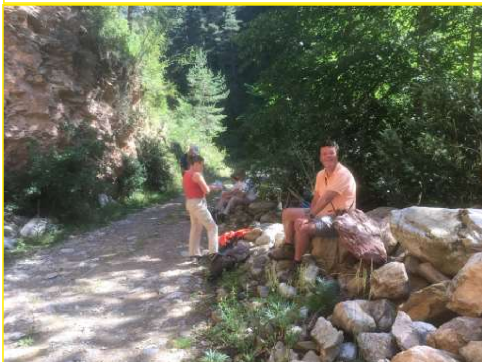
Prominent rechts in beeld: onze admin!

Hier ontstond de splitsing tussen de wandeling door de bergen en de "kruip"-wandeling door het moerasgebied.