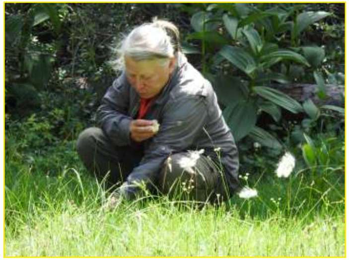
Twee van onze drie excursieregelaars in actie.