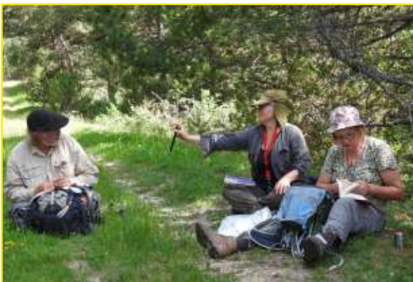
De excursieregelaars in overleg.

Deze kaart bevat belangrijke informatie zoals de aanduiding van wandelpaden, trekkershutten, schuilplekken, vegetatieverschillen, hoogtelijnen en andere informatie. Het is een volledige kaart van een uitstekende kwaliteit.