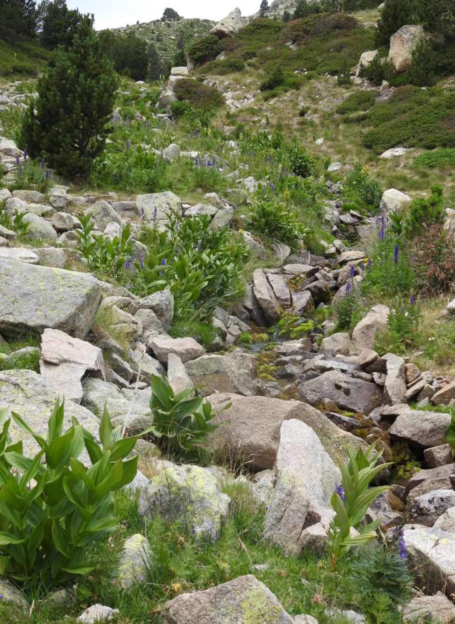
KNNV-zomerkamp Pyreneeën 2019