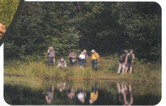
De moderne KNNV'er