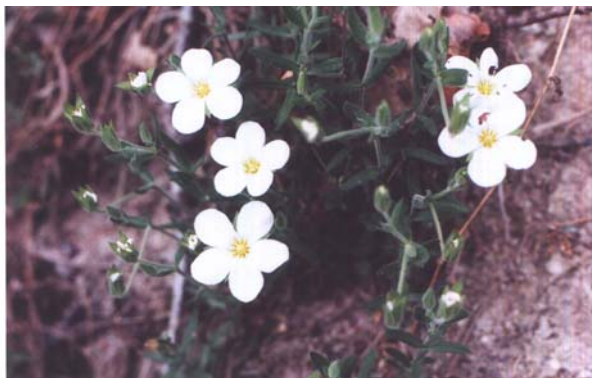
Arenaria montana “Berg-zandmuur”

Totaal 244 planten soorten genoteerd. (zie bijlage hogere planten, pag. 11 - 15) Ondanks de handicap van het zoek raken van de excursieformulieren geeft deze lijst een goed beeld van het gebied. Naast de, voor ons Nederlanders de “gewone soorten” zijn er een aantal die er uitspringen, zoals: Arenaria montana , “Bergzandmuur”, een zandmuur met mooie grote (16-24 mm) witte bloemen. In eerste instantie denk je dat je te maken hebt met een Stellaria (muur). Maar dan loop je vast. Aan Arenaria denk je niet direct. Maar na wat zoekwerk en de determineersleutel goed te volgen kom je er wel uit. Thuis gekomen zie je dat deze soort ook bij de tuincentra te koop is. Dan de Ranunculus paludosus heeft ook voor wat puzzelwerk gezorgd. Niet in elke flora wordt deze soort genoemd. In de “Grote Blamey, De Geïllustreerde FLORA” is zij wel opgenomen. De afbeelding komt niet goed overeen met de werkelijkheid zoals wij hem vonden. De grondstandige bladeren stonden vrij van de bloemstengel. Dit verschijnsel vind je niet direct terug in de flora. De Bergganzerik, Potentilla montana is ook een leuke vondst. Een ganzerik met mooie grote (13-20mm) witte bloemen en drietalige bladeren hebben een getande top. In diezelfde berm vonden we ook Simethis planifolia , een kleine “Graslelie”. De Boomhei, Muizendoorn en de Meekrap moeten zeker worden vermeld. Maar wat voor al bij blijft zijn de mooie, grote witte Affodillen.